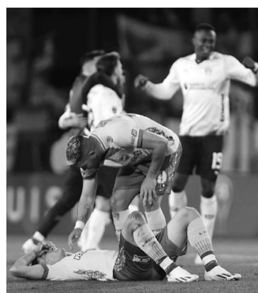
Final y tristeza en la cancha de Lanús.

Con su victoria en el global sobre Defensa y Justicia, Liga Deportiva Universitaria de Quito accedió a la final, partido definitorio que el 28 de este mes jugará contra Fortaleza. El equipo brasileño se clasificó luego de igualar