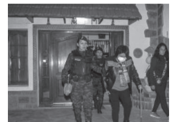
La dirigente padece una trombosis.

Previamente, la dirigente social había sido trasladada desde su domicilio ubicado en el barrio Cuyaya en un vehículo del Servicio Penitenciario de Jujuy. Sala se someterá en la capital bonaerense a dos intervenciones quirúrgicas, un posopera-