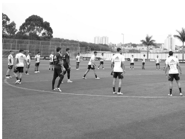
Decisivo. "Listos para dejar todo", publicó Boca en la red X.