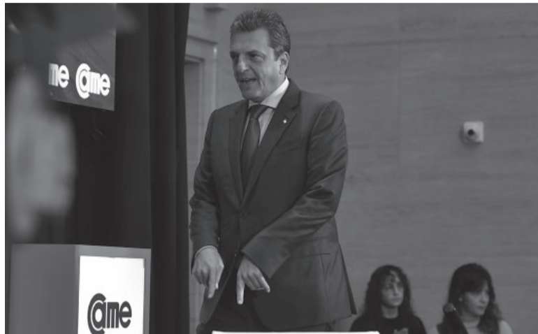
De campaña. Como en cada discurso, el también candidato presidencial destacó las recientes medidas económicas.

El ministro también destacó el blanqueo laboral por el cual en