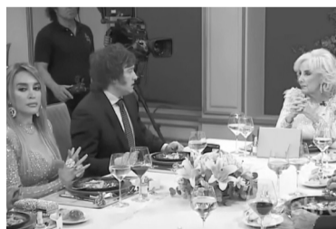
Vuelve el ciclo "La noche de Mirtha Legrand".

La mayoría de las víctimas son estudiantes de una escuela secundaria de Paso de los Libres, en la provincia de Corrientes, que regresaban del viaje de egresados.