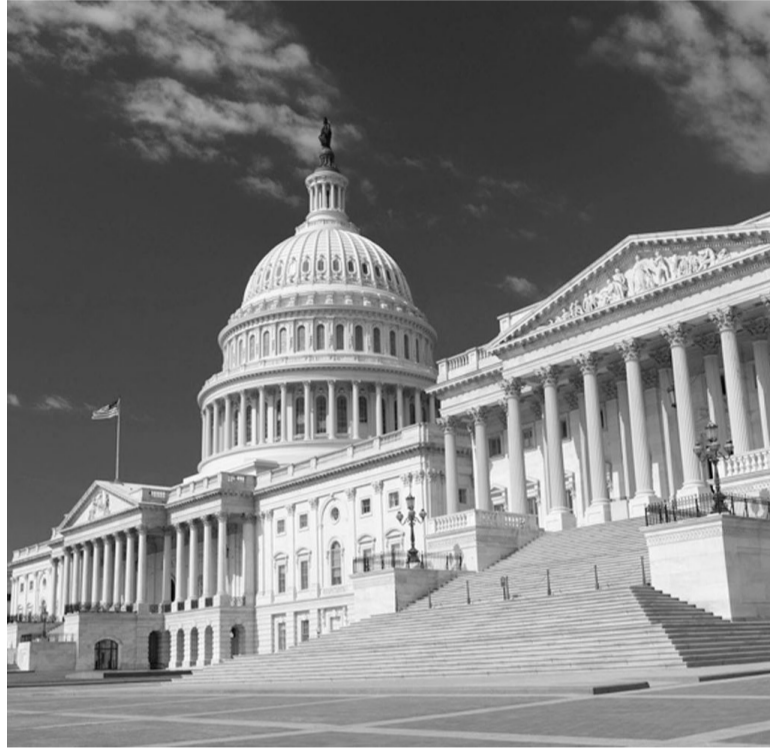
Días movidos. Tras la aprobación de un presupuesto de emergencia y la salida del líder demócrata, se define un nuevo escenario.

“Creo firmemente que esta conferencia es una familia. Cuando me dispararon en 2017, fueron