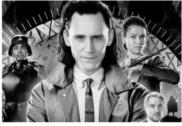
Tom Hiddleston en el papel de Loki.