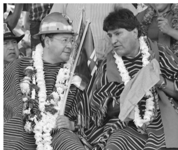
Ruptura política en Bolivia.

Otro de los puntos de la declaración indica que “las denuncias por transfugio y traición serán remitidas al Tribunal de Disciplina, para considerar su expulsión del partido político”, en una medida que apuntó a Arce y al vicepresidente David Choquehuanca y a otra