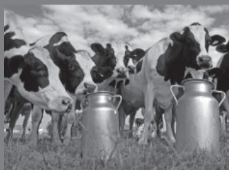
La inversión es de $10 mil millones.

El Gobierno suspendió hasta el 31 de diciembre las alícuotas del derecho de exportación actualmente vigentes para productos lácteos, a través del