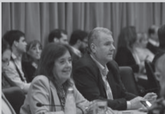
El diputado de JxC, Gerardo Milman.

La Cámara Federal de Casación Penal confirmó este miércoles la orden de secuestro del teléfono celular del diputado nacional de Juntos por el Cambio (JxC),