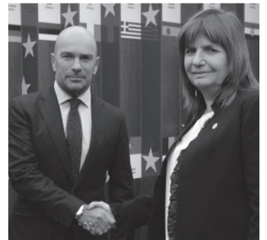
Reunión con el embajador de la Unión Europea. - X -

Durante una reciente entrevista en el canal A24, el libertario se refirió al pasado de la postulante de JxC y aseguró que "era una montonera tira bombas", que "ha puesto bombas en jardines de infantes" y que "era parte de una organización