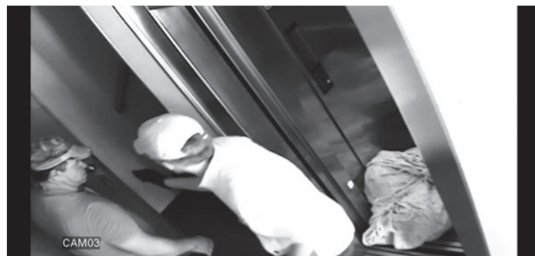
Prueba. Captura de pantalla del video clave para el juicio.