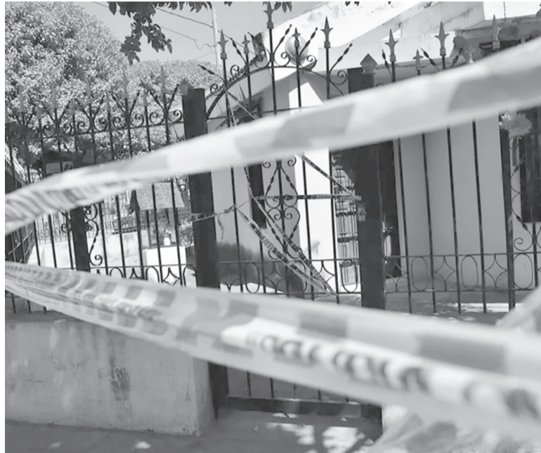
El lugar. El hecho ocurrió cerca de la medianoche del sábado, en una vivienda del barrio Los Molles. - La Voz -

Tras el enfrentamiento, uno de los sospechosos murió en el lugar, mientras que el otro escapó, dije-