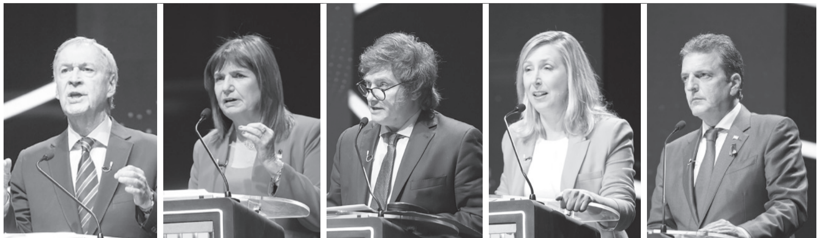
Por sorteo. Schiaretti (HNP), Bullrich (JxC), Milei (LLA), Bullrich (JxC) y Massa (UxP).

En materia de seguridad, Massa dijo que le exigirá "cuentas a la justicia" y creará una agencia federal, una suerte de "FBI argentino" instalado en Rosario. Bullrich aseguró que cuando se desempeñó como ministra de Seguridad enfrentó a "cada una de las mafias narcotraficantes y criminales", se comprometió a "entrar a Rosario" inclusive con "las Fuerzas Armadas" y a bajar la imputabilidad de menores a los 14 años, mientras que se mostró acompañada de Luis Chocobar, el