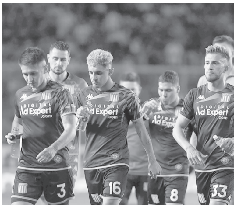
Silbidos. El equipo local se fue resistido por la gente.

Después de esa aproximación el local fue pura incertidumbre, no tuvo ideas en la gestación de juego y hasta el cierre de la primera parte tuvo la presión de jugar con