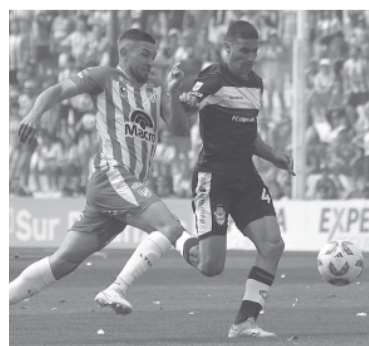
El equipo platense salió de la zona de descenso.