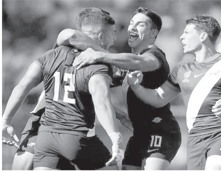
Desahogo. La selección sacó adelante un partido trabado.

El wing Mateo Carreras destacó el valor del seleccionado argentino, al asegurar que tiene “jugadores