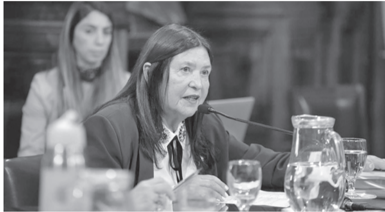
Discusión. La camarista Ana María Figueroa.

Figueroa cumplió 75 años en agosto y en septiembre la Corte Suprema la desplazó de su puesto en la Cámara Federal de Casación Penal invocando que no había logrado el acuerdo del Senado que necesitan los jueces con más de 75. Pero a fines del mes pasado el Senado logró juntar los votos para avalar la continuidad de Figueroa, en una decisión que luego refrendó el Po-