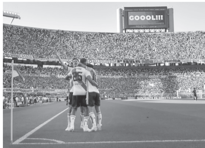
Estallido. 19 partidos seguidos ganados en el Monumental.

La primera llegada clara fue para River con el mano a mano que Rondón desperdició ante Guido Herrera, pero el venezolano se redimió favorecido por un blooper. El arquero de Talleres intentó cortar el centro de Andrés Herrera, iniciado en una jugada preparada tras un tiro de esquina, y en el camino se