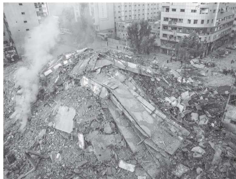
Horror. Respuesta israelí a la ofensiva de Hamas.

Hamas dijo que lanzó la operación cansado del bloqueo que Israel impone a Gaza desde 2007 y para vengar incursiones militares israelíes en Cisjordania, la