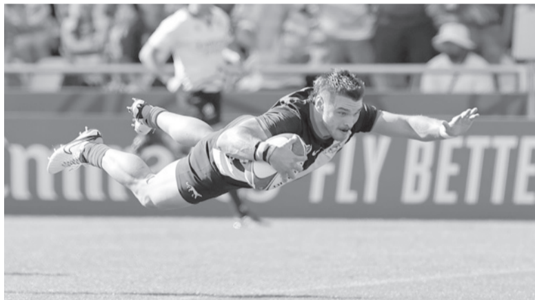
El wing fue la figura del partido con tres tries. - @Lospumas -

“Estoy muy orgulloso del equipo, seguimos una semana más en el Mundial y vamos a tratar de llevar la camiseta argentina cada vez más alto”, prometió el hooker. - Télam -