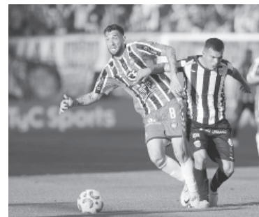
El "Funebrero" se quedó con las ganas.