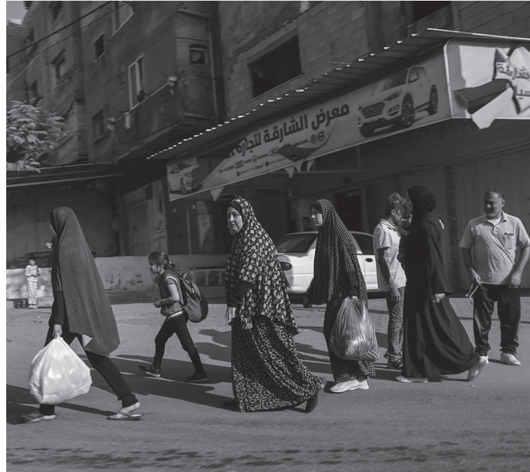
Comunicado. “Civiles de la ciudad de Gaza, evacúen hacia el sur”, exigió Israel.