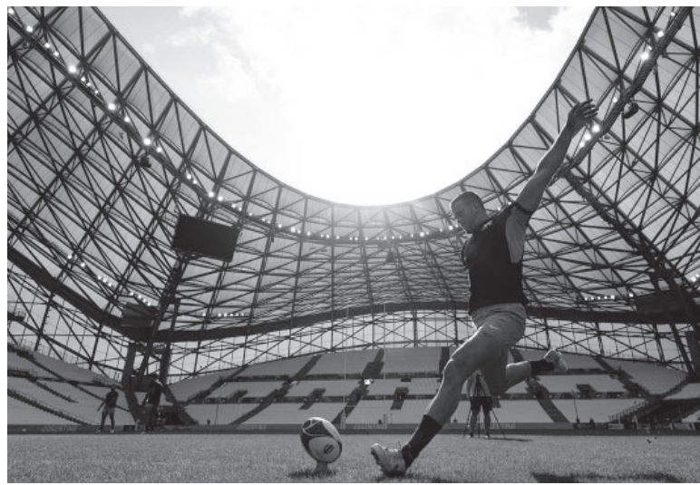
Importante. Boffelli, goleador del equipo en la Copa del Mundo. - Los Pumas -

Argentina logró un trabajoso avance a los cuartos de final. Tras la derrota ante Inglaterra (27-10) en un desafortunado debut a causa de una decepcionante actuación, llegaron los triunfos ante Samoa (19-10), Chile (59-5) y Japón (39-27), cada uno con distinto grado de dificultad según el nivel del adversario, pero evidenciado mejoras en el desempeño.