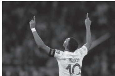
Mbappé superó a Platini.

Con el triunfo, el seleccionado subcampeón del mundo consiguió la diferencia necesaria para asegurarse uno de los dos primeros lugares de la zona, que ahora lidera con 18 puntos, seis