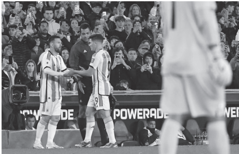
De a poco. El rosarino va tomando ritmo tras un parate por lesión.

cambio de esquema si es que Messi, al que se lo notó cómodo en las descargas y definiciones de pelota parada más que en movimiento, sale de titular en Lima; o mantendría los mismos nombres y disposición táctica de darse que el rosarino comience nuevamente desde el banco de suplentes.