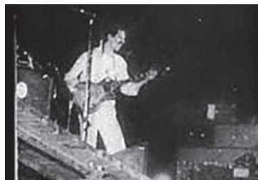
Carlos Santana en el Viejo Gasómetro.