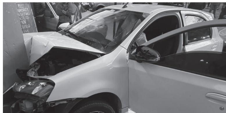
Huida. Así quedó uno de los vehículos de los delincuentes tras escapar del lugar del crimen.

El hombre fue abordado cuando bajaba de su camioneta Mercedes Benz Sprinter por al menos cuatro