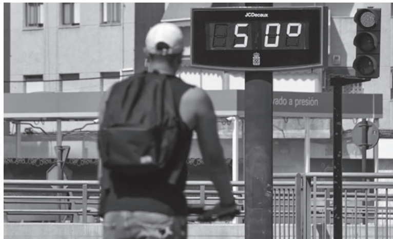
Calor. Septiembre de 2023 fue el cuarto mes consecutivo con temperaturas récord.

La “predicción fatídica” llega semanas antes de que los líderes mundiales se reúnan en noviembre en Dubái para la Conferencia de las Naciones Unidas sobre el Cambio Climático de 2023 (COP28), cita en