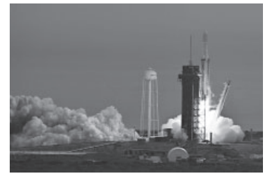
La misión Psyche.