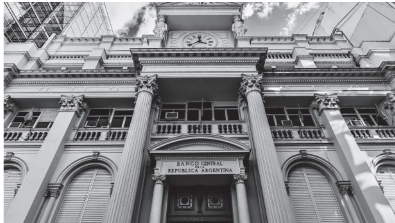
Decisión. El Banco Central fijó nuevas medidas para limitar la demanda de dólares.

El texto señala que los bancos "podrán cubrir total o parcialmente la posición de contado diaria" con "letras internas intransferibles del BCRA en pesos" como las Lediv, o "títulos públicos nacionales en