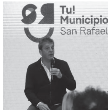
Massa, ministro y candidato.