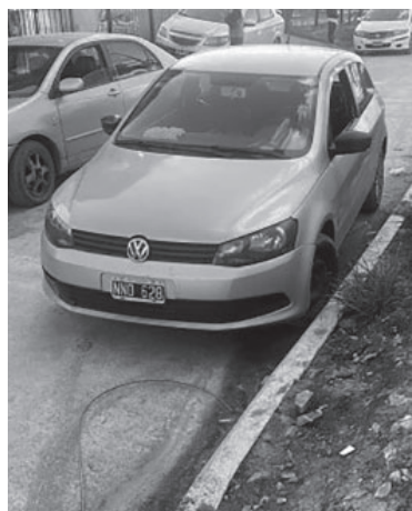
Ofrecían a la venta el Volkswagen Gol Trend robado.

Si bien los investigadores trabajaban con una serie de imágenes de cámaras de seguridad, fue un nieto de 23 años de Morales