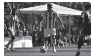
El 10, Thiago Almada. - @Argentina -