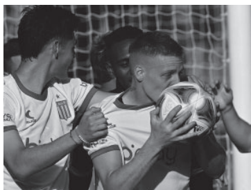
Desahogo para un equipo que venía golpeado.

■ Estudiantes se convirtió en el tercer semifinalista de la Copa Argentina, tras eliminar ayer a Huracán con una victoria por 2 a 0 en el Coloso Marcelo Bielsa de Rosario. El equipo de Eduardo Domín-