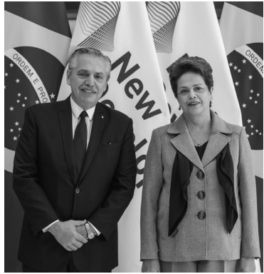
Fernández junto a Rousseff.