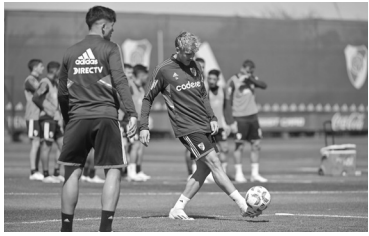
River juega mañana en Santa Fe. - CARP -