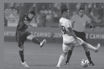
Messi, letal para el triunfo albiceleste.

"Después de la Copa América el equipo fue mucho más, a nivel de juego crecimos. Y después de la Copa del Mundo, el equipo se ve con mucha confianza, muy suelto. Juegue donde juegue, siempre quiere la pelota. Nos sentimos bien de hacerlo de esta manera, ojalá