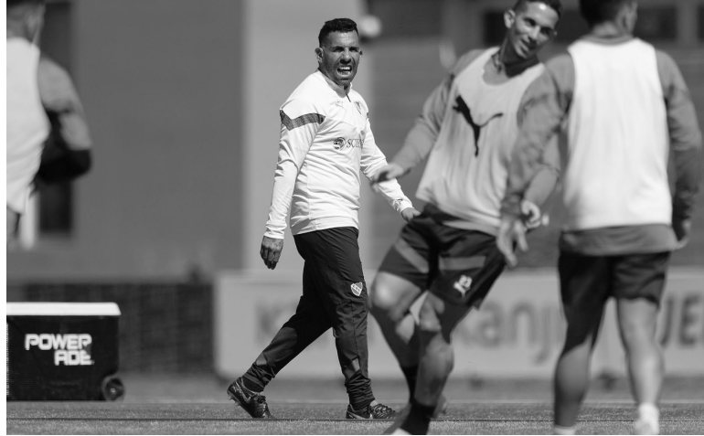
Altas y baja. Tevez recupera jugadores, pero pierde a Cauteruccio. - CAI -

Árbitro: Pablo Dóvalo. Cancha: Ciudad de Vicente López. Hora: 19.00 (TNT Sports).