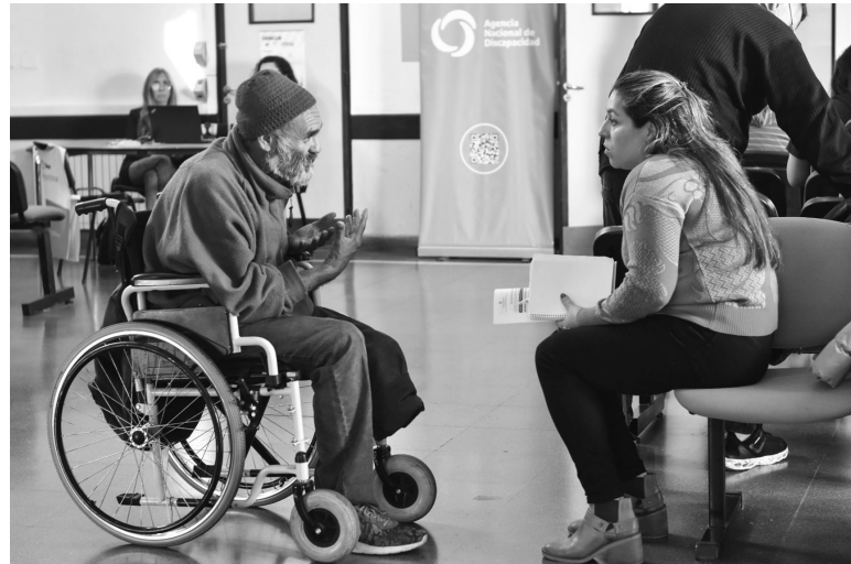
Certificación. Usuarios inician los trámites del CUD. - DIB -

blico y válido en todo el país que permite acceder a los derechos y a las prestaciones previstas en las Leyes Nacionales 22.431 y 24.901. La evaluación de su validez o no la