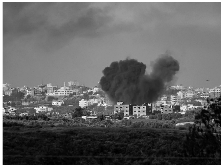
Horror. Los daños de la guerra.

En tanto, Abbas decidió dejar Jordania y viajar a la capital palestina en Cisjordania, Ramala, por lo que no participará en la reunión prevista para hoy con el presiden-