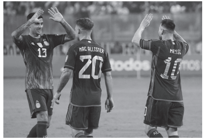
Choque los cinco. Nueva victoria de los campeones del mundo.

A los tres minutos del complemento, dejó la cancha "Cuti" Romero