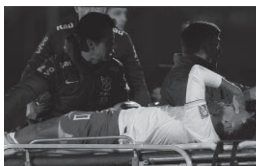
Neymar, lesionado, dejó la cancha desconsolado.

Por su parte, Paraguay consiguió su primer triunfo en las Eliminatorias Sudame-