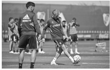
River juega mañana en Santa Fe. - CARP -