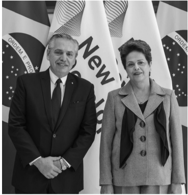
Fernández junto a Rousseff.