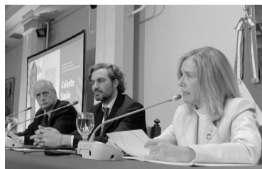
El Gobierno aceptó la renuncia de Celeste Saulo.

Cabe señalar que Saulo es la primera mujer y la primera latinoamericana en ocupar ese cargo. Su candidatura, que había sido impulsada por el gobierno argentino