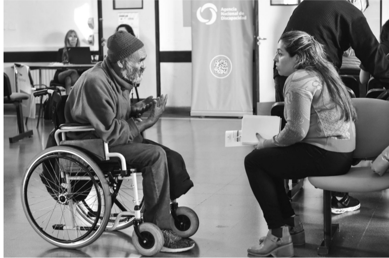
Certificación. Usuarios inician los trámites del CUD. - DIB -

blico y válido en todo el país que permite acceder a los derechos y a las prestaciones previstas en las Leyes Nacionales 22.431 y 24.901. La evaluación de su validez o no la