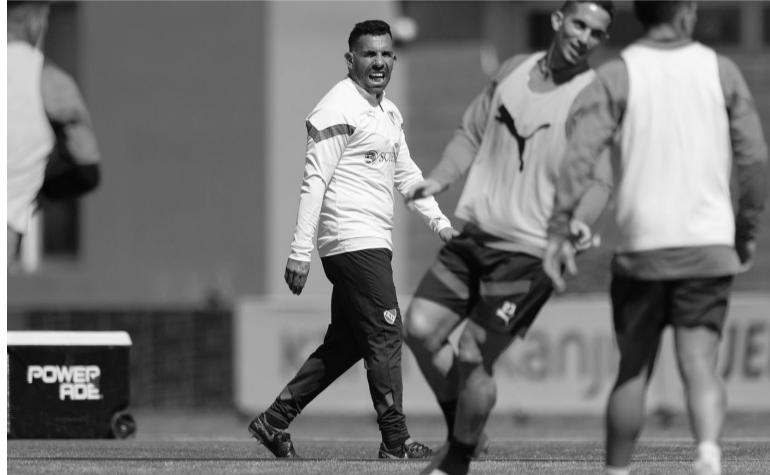
Altas y baja. Tevez recupera jugadores, pero pierde a Cauteruccio. - CAI -

Árbitro: Pablo Dóvalo. Cancha: Ciudad de Vicente López. Hora: 19.00 (TNT Sports).