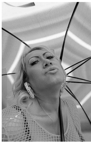
El cáncer de mama en Argentina provoca 6 mil muertes cada año. - Archivo -

Según datos del Instituto Nacional del Cáncer, en las mujeres cisgénero (es decir, aquellas cuya identidad de género coincide con el sexo asignado al nacer) el cáncer de mama es el de mayor incidencia, con 22.024 casos anuales, lo que representa el 32,1% de todos los tumores malignos en esta población, con una tasa ajustada por edad de 73,1 casos por cada 100.000 mujeres; en los varones cis, en cambio,