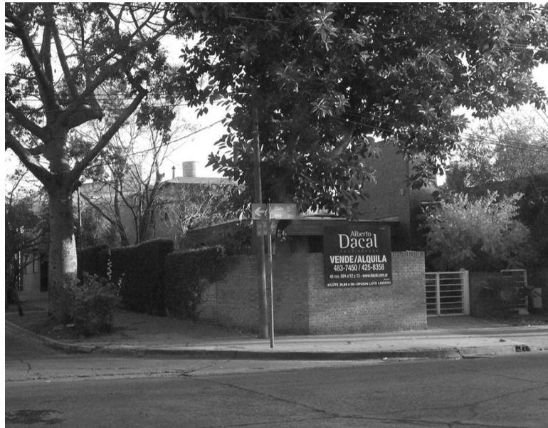
Cambio. La norma introduce una serie de modificaciones en el Código Civil y Comercial de la Nación.

La Cámara Federal de Apelaciones de Córdoba falló ayer a favor del cobro del aporte solidario y extraordinario a personas con alta capacidad contributiva por parte de la Administración Federal de Ingresos Públicos (AFIP), al rechazar un planteo de confiscatoriedad esgrimido por un empresario para no abonar el tributo. De acuerdo con la determinación de oficio del organismo conducido por Carlos Castagneto, el ciudadano deberá abonar un importe de capital de 121 millones de pesos más intereses. El contribuyente ya había recibido un fallo en contra de parte de un