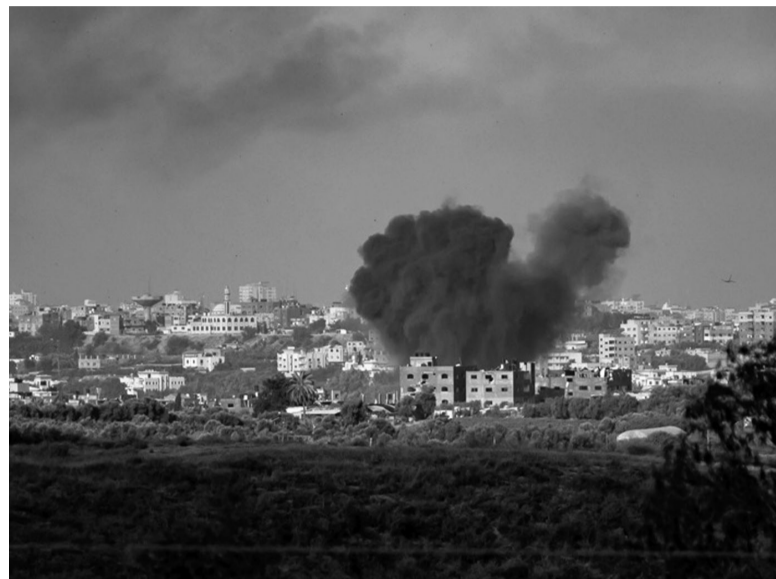
Horror. Los daños de la guerra.

En tanto, Abbas decidió dejar Jordania y viajar a la capital palestina en Cisjordania, Ramala, por lo que no participará en la reunión prevista para hoy con el presiden-