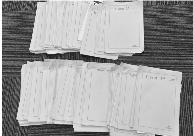
Material sensible. Las carpetas secuestradas por la AFIP, donde quedó registro de las maniobras evasivas.

La UIF recordó el operativo de la Policía Federal y de la AFIP (Administración Federal de Ingresos Públicos) en la calle Montañeses al 2200 de la Ciudad de Buenos Aires, con el secuestro de "una suma cercana a los setecientos mil dólares" que, a su vez "llevaron a nuevos allanamientos, que orientaron la presente investigación hacia la