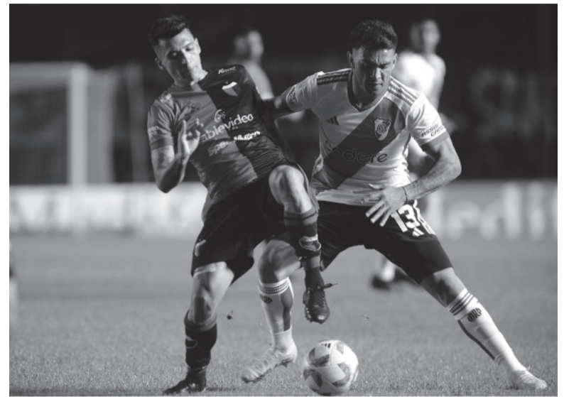
A mano. Igualdad en el Brigadier Estanislao López.

Fue con una jugada de estos últimos dos futbolistas que el local volvió a torcer el trámite, cuando Botta envió un pase pinchado, otra