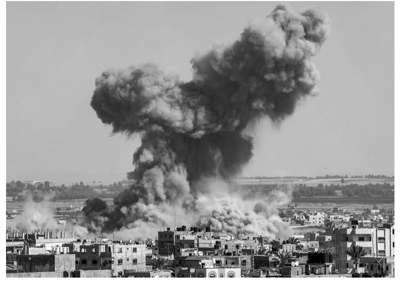
Crisis. Se estima que el 60% de los palestinos que viven en Gaza están a la intemperie sin agua ni atención médica.

có cientos de objetivos de Hamas en la Franja de Gaza, incluyendo puestos de lanzamiento de misiles antitanques, túneles, infraestructura de inteligencia y centros de mando.