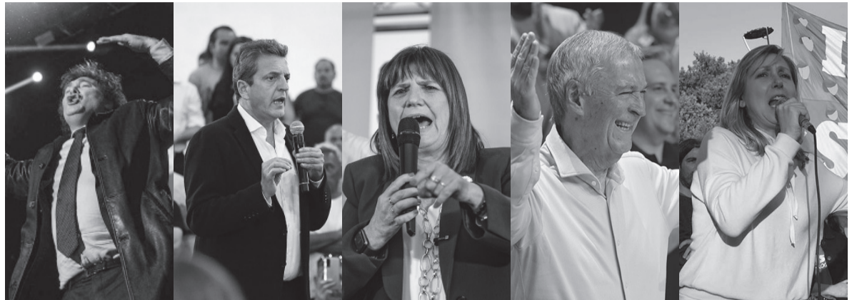
¿Primera vuelta o balotaje? Al menos tres de los postulantes quedarán fuera de carrera este domingo.

Luego, el postulante de Unión por la Patria agregó: “El domingo cada mujer y hombre de trabajo que crea en los valores, que vaya a la urna a buscar nuestra bandera”. “El domingo decidimos si amamos nuestra bandera o no. Quiero repetir: si mañana muriera y tuviera que volver a nacer y tuviera que volver a elegir dónde nacer, volvería a elegir