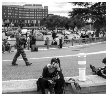
Francia, en alerta permanente. - Télam -

Ayer, la mayoría de los grandes aeropuertos franceses, salvo los parisinos Charles de Gaulle y Orly, fueron evacuados temporalmente