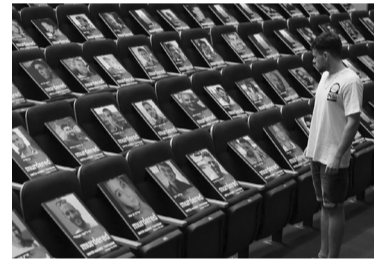
Una imagen de los rehenes. - Télam -

El número de personas que se dan por secuestradas por el movimiento Hamas durante sus recientes ataques en Israel ascendió a 203, dijo el Ejército de Israel, que antes había informado de 199 rehenes. “De momento, hemos notificado a las familias de 203 personas secuestradas”, indicó el vocero militar israelí general Daniel Hagari, informó la agencia de noticias Sputnik. - Télam -