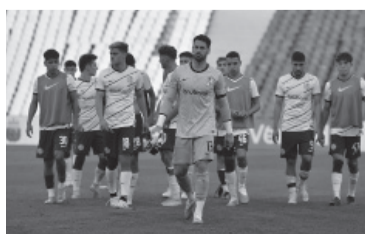
Mal presente del equipo de Insúa.

El invicto Godoy Cruz superó ayer a San Lorenzo, como local, en el estadio Malvinas Argentinas por 1 a 0, por la novena fecha de la Zona B de la Copa de la Liga Profesional. El "Tomba" mantuvo el invicto y en