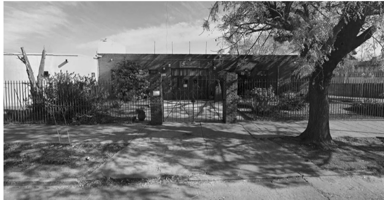
Conflicto. Frente del colegio donde sucedió el hecho.