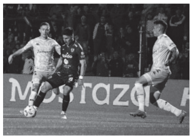
Agónico 1-1. - Sarmiento -