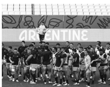
Una cita con la historia.

En su décima participación mundialista, el seleccionado nacional mostró una mejora notable en relación al inicio del certamen, incluidos los primeros triunfos, y desde la intensidad defensiva se basó la victoria fundamental contra los europeos, que llegaron como