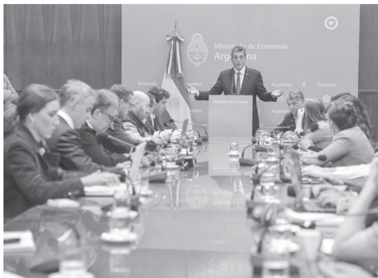
Anuncios. El ministro Sergio Massa junto a periodistas. - Ministerio de Economía -

El beneficio es una ampliación del que ya se oficializó para el agro, la industria petrolera, el sector automotor y la minería, con un 75%