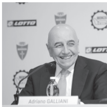
Adriano Galliani. - Archivo -

En segundo lugar se situó el Partido Socialista Suizo (PS), con un 17,4% de los votos, seis décimas más que en 2019, por lo que sumará dos escaños en el Consejo Nacional hasta alcanzar los 41, informó la agencia de noticias Europa Press. - Télam -