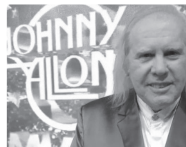
Creador del mítico "Johnny Allon Show". - Archivo -

Al fundamentar la calificación legal del homicidio con "alevosía", los jueces argumentaron: "Ha matado a traición, sin riesgo, sobre seguro, con astucia y aprovechando que la víctima estaba desprevenida al salir del ascensor y entrar a su departamento. Eligió la ocasión, esperó oculto y sin peligro". - Télam -