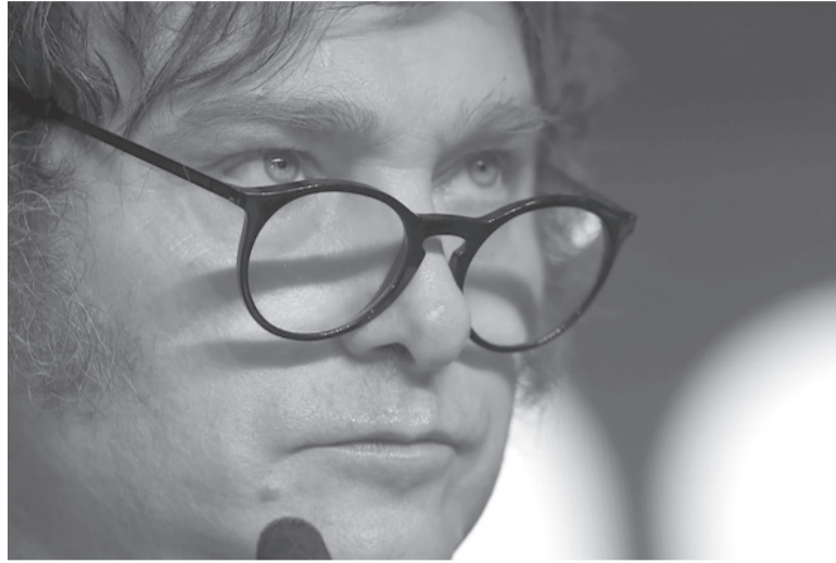
Estrategia. Milei cambia insultos por elogios.

El miércoles será el día elegido por los líderes de la UCR para definir una postura. Si bien puede