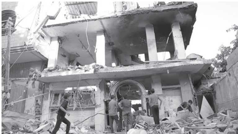
Ataque. Aviones israelíes atacaron objetivos en territorio palestino.

Desde la sangrienta incursión de Hamas en Israel, el 7 de octubre, solo una mujer estadounidense y