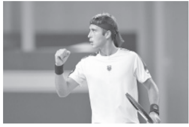
Etcheverry se metió en octavos.