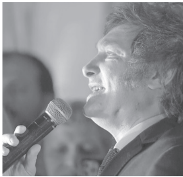
El economista habló en La Nación+.

Ahora el candidato busca negar esa presunción, al afirmar que “nunca dijimos que íbamos a ganar en primera vuelta”, y habló de un