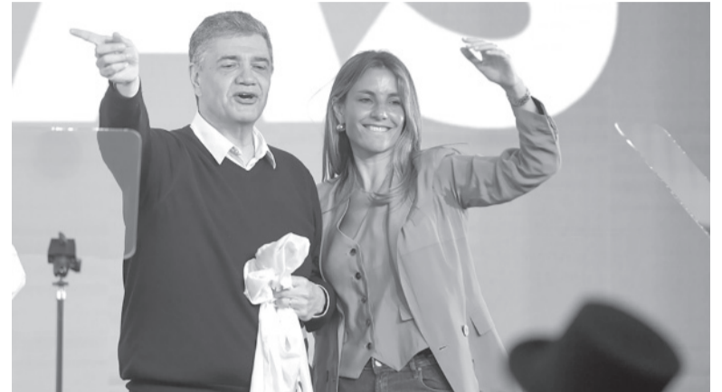
Triunfal. El primo del expresidente había quedado a un paso del 50% necesario, lo que hacía utópico un triunfo peronista en un bastión históricamente PRO.

La medida de la oposición porteña comenzó a ser analizada desde el domingo. Inicialmente, habían optado por esperar los resultados del escrutinio definitivo. Según la normativa, el ganador tiene que alcanzar el 50% de los votos y, si eso no ocurre, debe volver a competir en un balotaje. Sin embargo, la proximidad de Macri a una victoria