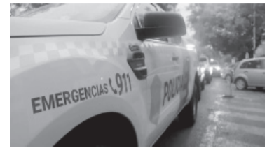
Fallo del TOC N°2 de La Matanza.