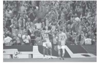
Gran momento del rosarino. - Galatasaray -