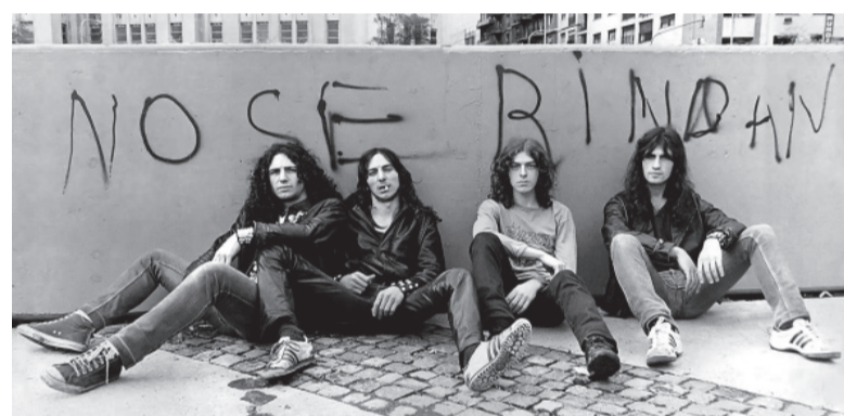
Fundador de V8, la piedra fundacional del heavy metal argentino.