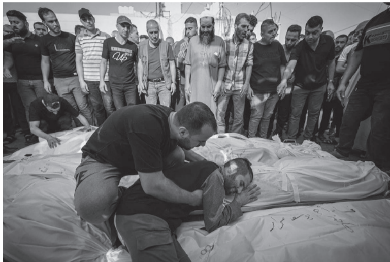
Caótico. El enclave palestino está bajo asedio total desde el inicio del conflicto: sin suministros de agua, comida, electricidad y combustible.

“Señor secretario general, ¿en qué mundo vive?”, le contestó el canciller israelí, Eli Cohen, tras recordar que su país “no solo tiene el derecho de defenderse”, sino también “el deber de hacerlo”. A la vez, el embajador israelí ante la ONU, Gilad Erdan, pidió la renuncia “inmediata” de Guterres. “El secretario general, que se muestra comprensivo con la campaña de asesinatos masivos