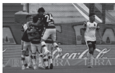
Victoria clave por la permanencia.

Gimnasia venció ayer a Barracas Central por 2 a 1, en un duelo clave y directo por la permanencia en la primera división, correspondiente a la décima fecha de la Zona A de la Copa de la Liga Profesional.