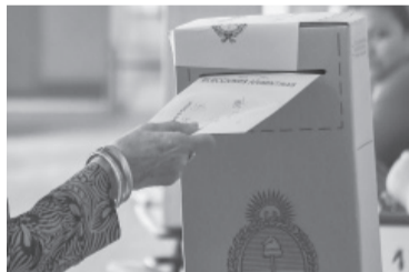
El recuento, decisivo en La Plata.

Escrutinio definitivo. El escrutinio definitivo de las elecciones del domingo, a cargo de la Cámara Nacional Electoral y único con validez legal, comenzó anoche en algunos distritos mientras que