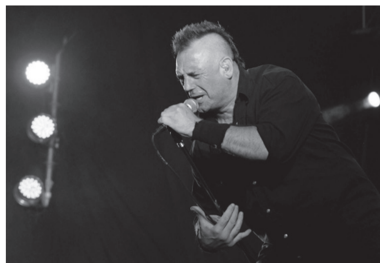
Pérdida. Ricardo Iorio, una incómoda voz que amplificaba el sentir de millones de personas.

Tan poderoso resultó el influjo de V8 que de las esquivas de su separación surgieron nuevas bandas que ampliaron la oferta para aquellos jóvenes del conurbano que, así como avanzados los '90 eligieron a la cumbia y actualmente optan por los ritmos urbanos como canal de expresión, en aquellos años conformaban el grueso del público