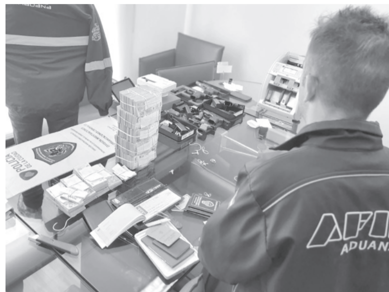
Botín. No solo se investiga al titular de Nimbus por sus operaciones en el mercado sino también por el lavado de dinero proveniente del narcotráfico.

Pulenta fue detenido en el barrio cerrado "El Encuentro", de Benavídez, en tanto que "El Croata" fue aprehendido en el barrio "El Golf", en Nordelta, ambos en el partido bonaerense de Tigre. En los allanamientos, personal policial y de la Aduana lograron