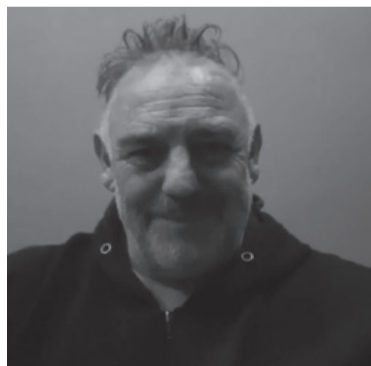
Última comunicación con Juanchi Baleiron, a horas de la muerte.

Pero a medida que fueron pasando los años, el “Iorio personaje” le fue ganando al “Iorio artista” en la consideración popular, sobre todo a partir de algunos comentarios y actitudes polémicas. Los comentarios xenófobos, racistas y antisemitas no encontraron filtros en boca de esta figura, que incluso sufrió la censura cuando fue eliminado de la grilla del Festival B.A.Rock que se realizó en 2017 en el predio Malvinas Argentinas, del barrio porteño de La Paternal, por la publicación de una foto suya abrazado al referente neonazi local Alejandro Biondini. Lejos de retractarse, Iorio reafirmó su pensar y su sentir cada vez que le pusieron un micrófono cerca. Pero eso tampoco le significó el rechazo del resto de sus colegas; por el contrario, la mayoría de los artistas nunca dejaron de reconocerle su frontalidad, su coherencia y su hombría de bien.