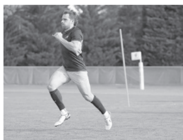
El apertura tucumano.

Aun cuando todavía no lo hizo público y recién lo haría mañana,