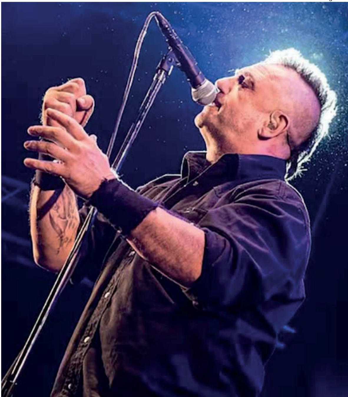
- Rolling Stone -

tácticas. En tanto, continuaron los bombardeos, que ya dejaron casi 5.800 muertos, y la OMS exigió un "alto el fuego humanitario" para poder distribuir ayuda de forma segura. El jefe de la ONU condenó al grupo islamista Hamas pero al mismo tiempo recordó que la población palestina ha sido objeto de "56 años de ocupación sofocante". - Pág. 6 -