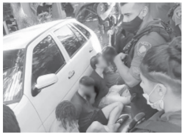
Detenidos por la violación en grupo.