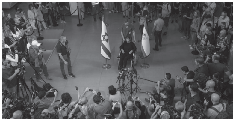
Una israelí liberada aseguró haber sido “bien tratada”. - Télam -

El enclave palestino está bajo “asedio total” desde el 9 de octubre, sin suministros de agua, comida, electricidad y combustible, aunque desde hace unos días comenzó a recibir ayuda humanitaria a cuentagotas por el paso de Rafah, en la frontera con Egipto. - Télam -