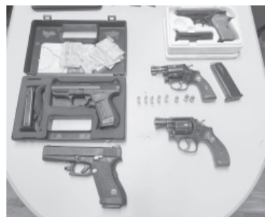
Las armas incautadas de la casa de Rojnica.

La investigación en el juzgado de Lomas de Zamora se vincula al "cártel de Sinaloa", y comenzó en 2017 con el secuestro de 1.375 kilos de cocaína escondidos en bobinas de acero en la ciudad bonaerense