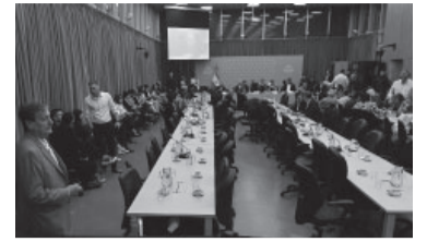
Proyectan un breve crecimiento.