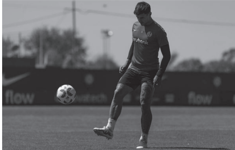
Importante. Bareiro, la carta de gol del equipo de Insúa.

En tanto, por el Grupo E, Atlético Madrid, conducido por el argentino Diego Simeone y donde jugaron Nahuel Molina, Rodrigo De Paul y Ángel Correa, rescató un punto como visitante ante Celtic de