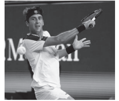
El tenista platense.