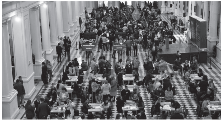
Escrutinio definitivo. Paralelamente, el recuento de votos bonaerenses comenzó formalmente ayer en La Plata.

"Motiva esta solicitud la necesidad de favorecer y garantizar la concurrencia de la ciudadanía a ejercer el sufragio en dichos comicios, que se vería indudablemente afectada si se mantuviera el fin de semana extendido con el referido feriado", sostuvo el funcionario judicial.