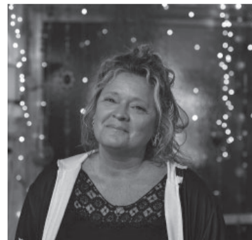
La comunicadora tenía 54 años.

Los restos de Ricardo Iorio, máxima figura del heavy metal argentino que falleció el martes tras un infarto, fueron velados ayer en una sala de una de las colonias alemanas ubicadas en el partido bonaerense de Coronel Suárez. El velatorio, según indicaron allegados y medios locales, se llevó a cabo a pedido de la mujer del cantante y de sus familiares se produjo entre las 11 y las 17 en las dependencias de la Cooperativa Eléctrica San José, en el pueblo de San José, una de las colonias alemanas del distrito de Coronel Suárez, donde Iorio vivió muchos años en un establecimiento rural. Luego del velatorio, y por propio pedido del cantante, sus restos serán trasladados a la ciudad de Bahía Blanca para ser cremados. - DIB -