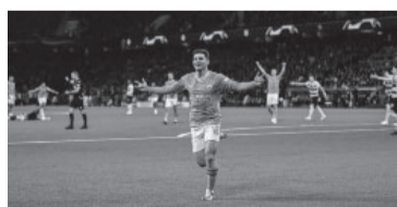
La felicidad del argentino.

El certamen tiene cuatro campeones argentinos a lo largo de la historia: Guillermo Vilas en 1978, David Nalbandian en 2002, Guillermo Coria en 2003 y Juan Martín Del Potro en las ediciones de 2012 y 2013.