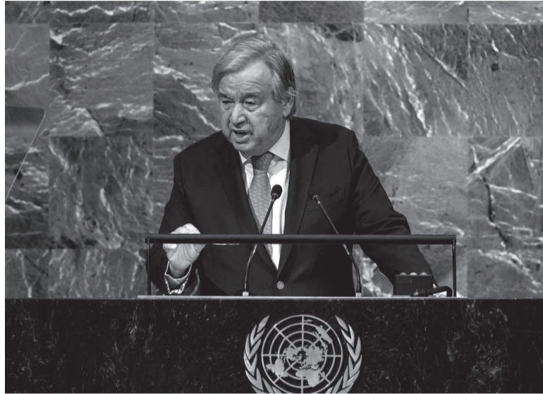
Dichos. Piden la dimisión del secretario general António Guterres.

"Al iniciar mi intervención ayer, dije claramente: 'He condenado inequívocamente los actos de terrorismo horribles y sin precedentes perpetrados por Hamas en Israel el 7 de octubre. No puede haber justificación para matar, herir y secuestrar deliberadamente a civiles, ni para disparar cohetes contra objetivos civiles'", manifestó el portugués en una conferencia reproducida por la agencia de noticias AFP.