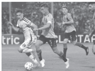
1-1 con Central Córdoba.