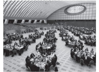
Discuten el futuro de la Iglesia.