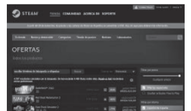
Una leyenda advierte el cambio en el borde superior de la tienda. - DIB -

Steam es una plataforma digital de videojuegos desarrollada por Valve Corporation. Sirve tanto de sitio de e-commerce para compras digitales como de