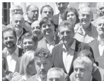
El gesto alegre del candidato de UxP.

Se espera que asistan, además de Kicillof, el gobernador de Tucumán,