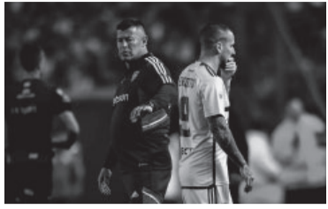
"Pipa" tiene "una contractura".