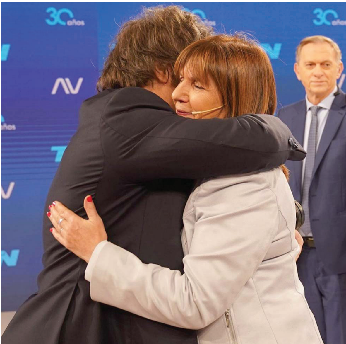
Los nuevos aliados se encontraron y abrazaron anoche, en el programa A Dos Voces de TN. - Captura de video -

Con el expresidente Macri como gestor del acuerdo, la derrotada candidata presidencial confirmó que acompañará con su voto al liberal en la segunda vuelta en la que enfrentará a Massa. "Nos perdonamos mutuamente", aseguró la titular del PRO. - Pág. 3 y 4 -