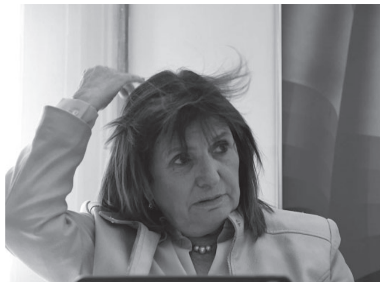
Enemigos íntimos. Pese a la munición cruzada, la titular del PRO señaló que con el libertario “se perdonaron mutuamente”.

“Anoche tuve un encuentro con Milei donde tuvimos una charla respecto a lo que habían sido sus declaraciones y en el ámbito privado nos perdonamos mutuamente. Fuimos capaces de perdonarnos mutuamente”, reveló Bullrich al ser consultada por los agravios y declaraciones que se realizaron durante la campaña, donde Milei llegó a acusarla de “montonera asesina”, motivo por el que la presidenta del PRO mantiene -por el momento- una denuncia penal contra el libertario.