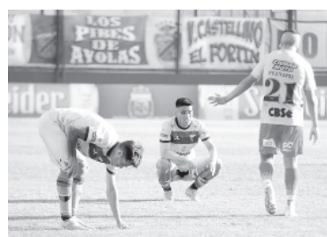
Una derrota que complica.

Arsenal, ya descendido, venció a Colón por 1 a 0 y lo dejó en zona de descenso en la Tabla Anual, al finalizar el partido jugado ayer en Sarandí correspondiente a la décima fecha de la Zona A de la Copa de la Liga Profesional.