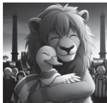
El dibujo diseñado por una IA. JMILEI

El candidato presidencial de La Libertad Avanza, Javier Milei, celebró el aval público de Bullrich con una imagen publicada en través de su cuenta en la plataforma