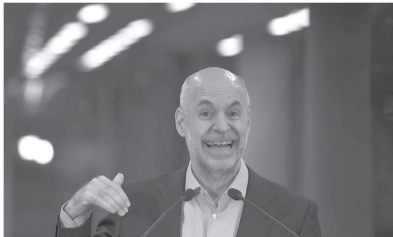
Tajante. Para el exprecandidato, resulta imposible apoyar tanto una “continuidad del populismo” como un “salto al vacío” como LLA.

Según remarcó el alcalde porteño, las iniciativas planteadas durante la campaña por el candidato de La Libertad Avanza, como la venta de órganos y la de armas, “están en los bordes de la democracia y son peligrosas”, por lo que aseguró que no cree “en nada de lo que propone”. Asimismo, se mostró crítico