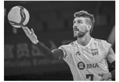
Derrota ante Polonia.