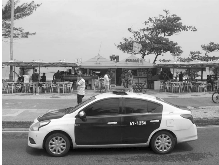
Escena. El bar donde los tres traumatólogos fueron ultimados, aparentemente por error.

el diputado federal Glauber Braga, famoso por sus discursos contra las milicias de Río de Janeiro, los grupos parapoliciales de ultraderecha conocidos como escuadrones de la muerte que le disputan negocios a los narcos.