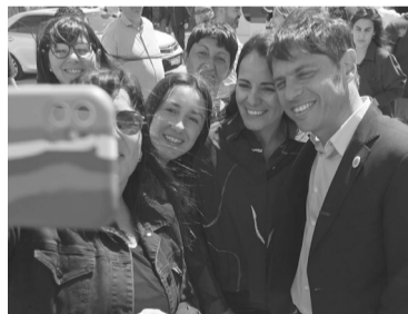
El trayecto iniciará en Berisso y culminará en La Matanza.

El jueves, en declaraciones a la prensa al ingresar a una reunión con empresarios que se desarrolló en forma paralela al Coloquio de IDEA, en Mar del Plata, Milei indicó que "cuanto más alto" esté la divisa del mercado paralelo "más fácil va