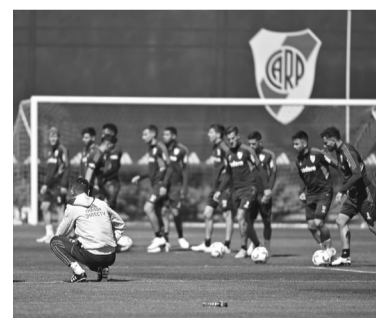
Trabajo en el River Camp. - CARP -

El equipo de la "Docta", que venció en los dos partidos que jugaron este año, tiene un historial favorable ante River de seis triunfos y tres derrotas desde que regresó a