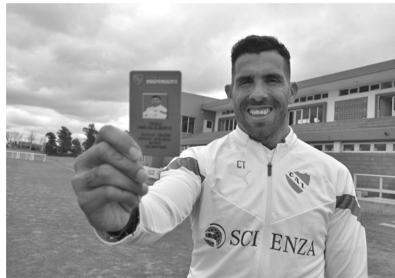
En racha. Tevez, el DT y ahora socio del "Rojo" de Avellaneda. - CAI -

El "Xeneize", que obtuvo resultados pobres durante todo el año en los torneos domésticos y sólo respondió a las expectativas en la Libertadores, quedó a un solo paso de su gran sueño y concentrará sus esfuerzos en la final del mes próximo en el Maracanã. - Télam -