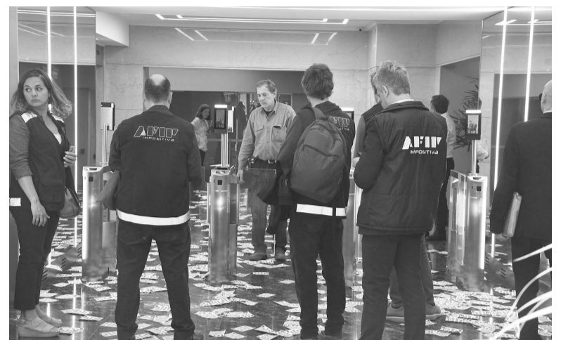
Conmoción. En los diversos procedimientos realizados en el Microcentro, se detectaron maniobras fraudulentas.

El dólar cripto o dólar Bitcoin cotiza en los $879,97, según el promedio entre los exchanges locales reportados por Coinmonitor.