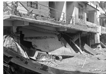
Suben las víctimas en India.

India.- Al menos 40 personas murieron en las inundaciones causadas por el desbordamiento de un lago glaciar en el noreste de India, según un nuevo balance comunicado ayer por las autoridades locales. V.B. Pathak, un funcionario de la administración del estado de Sikkim, donde se sitúa el lago, informó que hasta la fecha se recuperaron "19 cuerpos", en