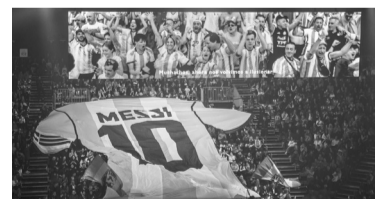
“Messi10”, el espectáculo de Cirque du Soleil. - Télam -

Explicó que “gracias a la regulación de esta ley, podemos poner en práctica esta terapéutica que nos abre la posibilidad de ver desde otro lugar a nuestra profesión”. - Télam -