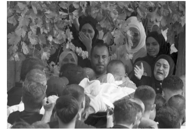
El enfrentamiento se dio en Huwara.