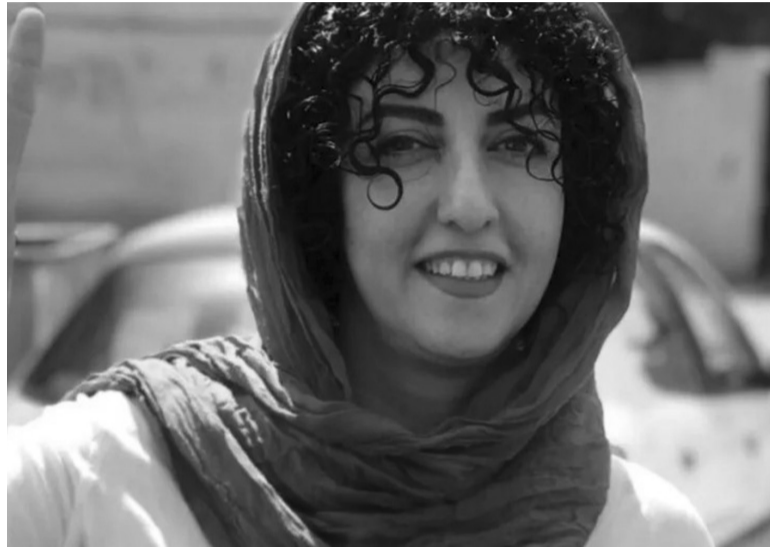
Lucha. La activista de derechos humanos iraní Narges Mohammadi fue elegida como la nuevo Premio Nobel de la Paz.

“Dedicamos este premio a todos los iraníes y, en especial, a las mujeres y niñas iraníes que han inspirado a todo el mundo por su