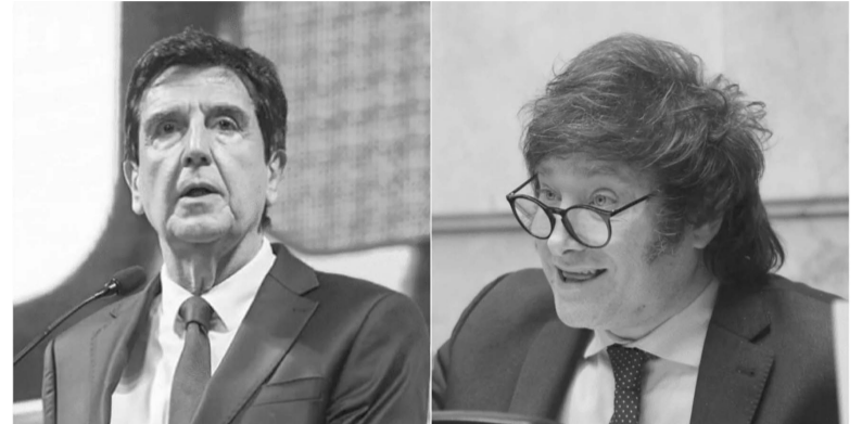
Cruzados. Carlos Melconian, candidato de Patricia Bullrich, consideró como un "delirio" los dichos de Milei.

Allí, el punto de inicio será desde las 16.30 en la calle Azul y Colectora Ruta 3 desde donde realizarán un recorrido de 13 cuadras hasta la Plaza Dorrego de González Catán, en la calle Soberanía Nacional 6.550, donde se realizará el acto final, con la presencia de Massa, De Pedro, Máximo Kirchner, Tolosa Paz y Di Tullio.