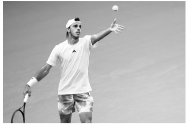
"Fran" derrotó a McDonald. - ATP -