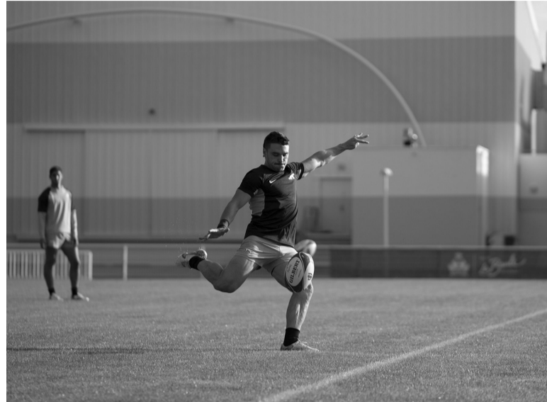
Práctica. Anteúltimo ensayo antes del partido clave. - Los Pumas -

"Los Pumas" presentarán la misma formación que cayó ante Inglaterra en el debut, el 9 de sep-