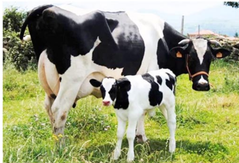
Una de las vacas y su pequeña cría, que son separadas a los pocos

Y en conmemoración a esta labor todos los 14 de noviembre se celebra su día. INTA, desde el año 2007 realiza en todo el país el curso "El Profesional Tambero",