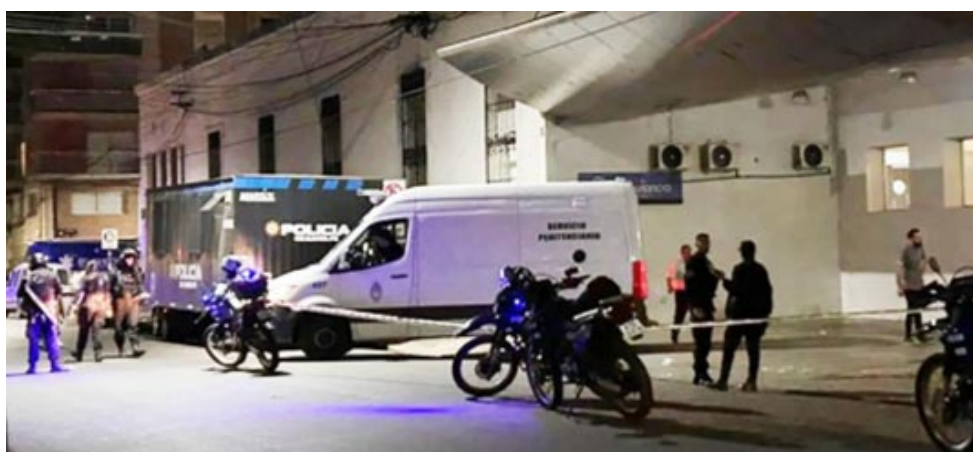
Postal de la sucesión de controversia que desde Rosario, afecta a todo el país. Las drogas son el motor de la violencia y nadie sabe cómo detenerlo.