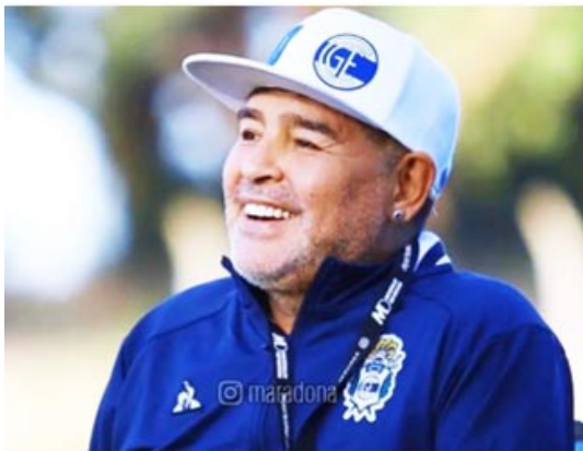
Maradona sonríe en la foto pese a los achaques físicos.

SE OFRECE niñera y servicio doméstico por la mañana, con referencias comprobables muy buenas. Responsable. Comunicarse al 2342-531568.