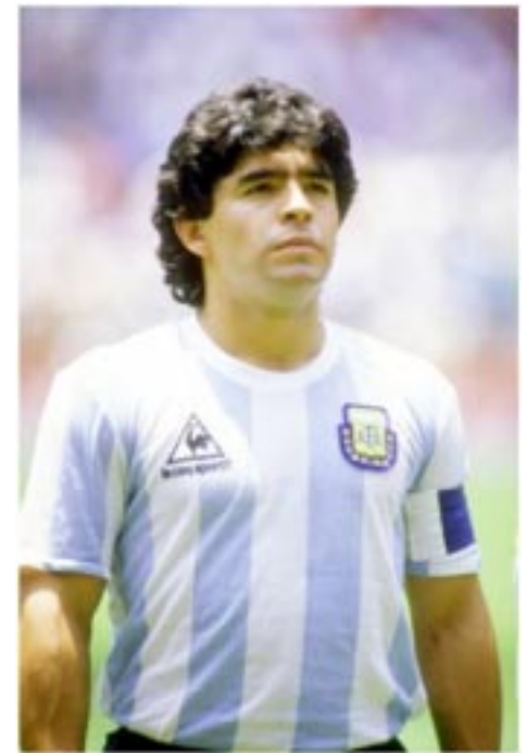
Diego con la casaca argentina en el comienzo de su carrera.

Diego vivió en la humildad y llegó a lo más alto de la fama, gracias al fútbol. El último tramo de su existencia después de ser técnico de Gimnasia y Esgrima, lo pasó mal, estando internado y aceptando una operación que no resultó y se alejó en medio de la soledad. Siempre había creído que era fácil rodearse de amigos, aunque en la práctica no le fue bien.