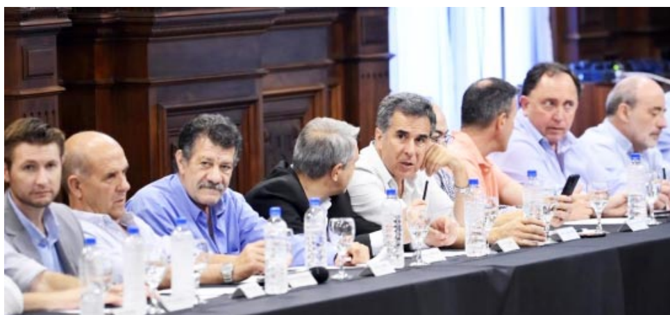
El intendente electo de Bragado, junto a sus pares, en La Plata.

En ese punto, Kicillof transmitió a los intendentes que se planteó la situación