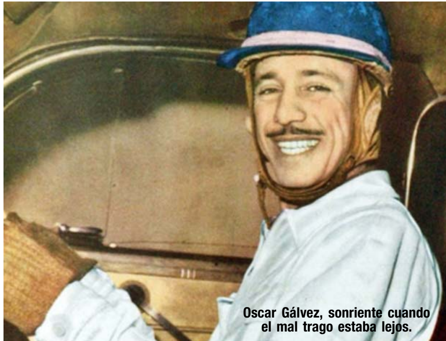
Oscar Gálvez, sonriente cuando el mal trago estaba lejos.

Oscar Gálvez fue ganador en 1.949, de una carrera donde estaban las figuras del mundo, que se corrió en Palermo. Ese día llovió y el triunfo de ese piloto argentino fue la carta de presen-