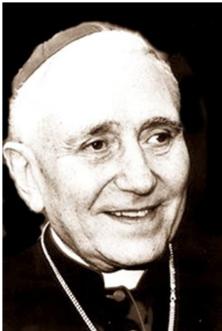
El Cardenal Eduardo Pironio nació en 9 de Julio y será beatificado en reconocimiento a su tarea.

Los actos a cumplirse fueron explicados por el Obispo Ariel Torrado Mosconi y constituyen una valorización de la santidad y condición humana del sacerdote nacido en 9 de Julio. Los fieles podrán visitar una casa donde nació Pironio que se mantiene intacta ante el paso del tiempo. También se conserva la pila bautismal donde fue bautizado.