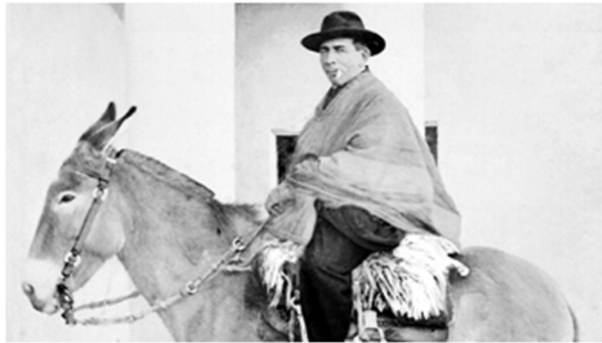
El Cura Brochero ejerció su tarea como sacerdote en la provincia de Córdoba.