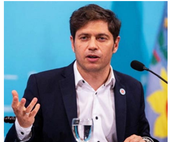
El Gobernador Provincial, ayudará a Bragado.