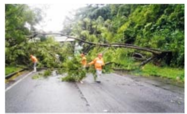
Los árboles protegen, pero también destruyen cuando el clima no ayuda a mantenerlos de pie.

Es cierto que las dificultades económicas son muchas y que vienen de lejos, eso no significa que haya que desoír los reclamos. En todo caso, ha sido una actitud de acompañamiento a las políticas del anterior gobierno nacional. Todo debe tener un sentido de equilibrio; no es posible rechazar las medidas nuevas que sólo tienen 10 días de aplicación.