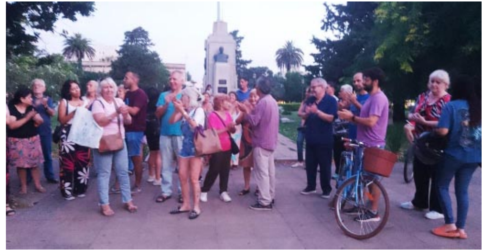
autoridades municipales. Además, luego de cantar frases en contra de Milei, entonaron el himno nacional.

Milei en su primer DNU. Allí se reunieron para dialogar entre vecinos y hacer juntos un "cacerolazo". Durante el encuentro, reclamaban a viva voz la presencia de las