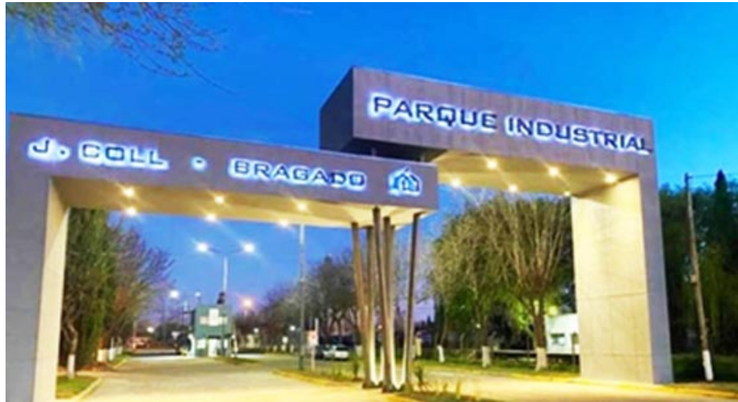
La industria en Bragado lleva más de 60 años de estar y acompaña al país en su desarrollo.

El deporte en general ha tenido un buen año. El fútbol reiterando el regreso a posiciones de vanguardia por parte de Bragado Club es una actividad que, a través de sus equipos, unifica las ansias de amistad y adelanto, síntesis de un proyecto co-