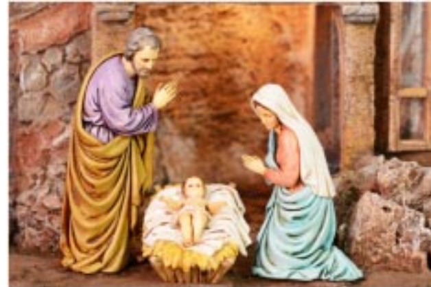
Imagen del Nacimiento, lugar al que llegaron los reyes guiados por una Estrella.

La dicha se interrumpió, Afirman las Escrituras, Al mismo tiempo que Herodes Decretó la mano dura.