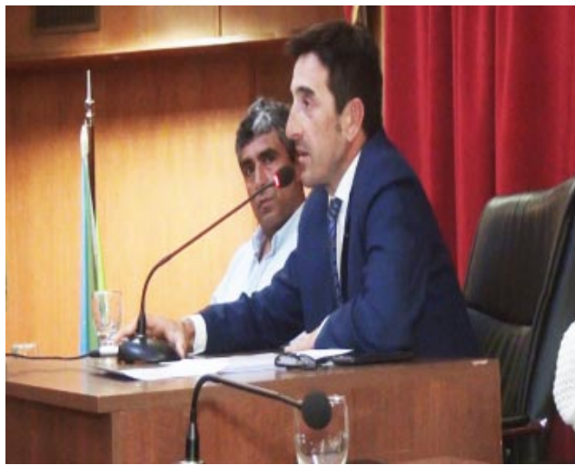
y señaló la actual situación de pobreza en Argentina.