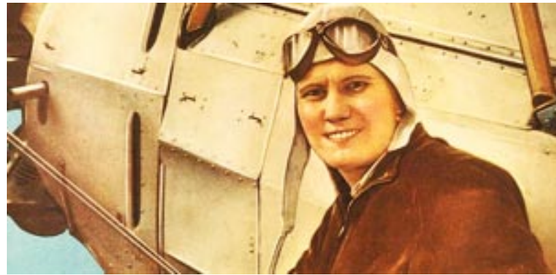
Carola Lorenzini, valor y temple de una aviadora argentina, trágicamente muerta en 1.941.

Carola Lorenzini, aviadora argentina autora de peligrosos vuelos en un tiempo donde la presencia femenina era apenas un atisbo de lo que después sucedió. El 31 de marzo de 1935 batió el récord sudamericano femenino de altura,