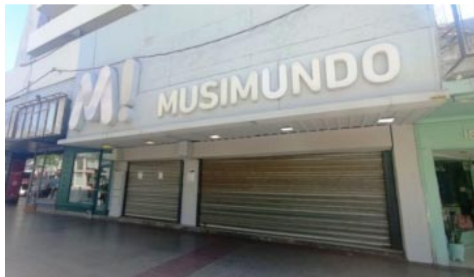
Empleado y clientes se encontraron este martes con el local de Musimundo en Junín cerrado.

dio en 2018. Ese año, Musimundo, bajó sus persianas en la sucursal de Luján, Tandil, Trenque Lauquen, Pehuajó, Bragado, Chivilcoy y Mercedes. En algunas de estas ciudades, las sucursales eran rentables, en otras pagaban los alquileres más caros de esas