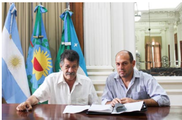
Faltas serán designados por el intendente municipal", previo acuerdo del Deliberativo.

Dicho nombramiento se dio de manera simultánea a la presentación en el Concejo Deliberante de un proyecto para impulsar la instancia del concurso, pese a que la normativa vigente, el Decreto-Ley N°8751/77 (Código de Faltas) prevé que "los jueces de