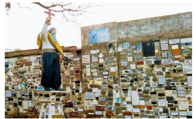
Estatua de Pancho Sierra en el cementerio de Salto.

Así, juntos, se los ve a la Madre María y a Pancho Sierra en un memorable filme de Lucas Demare de 1974 que lleva como título el nombre por