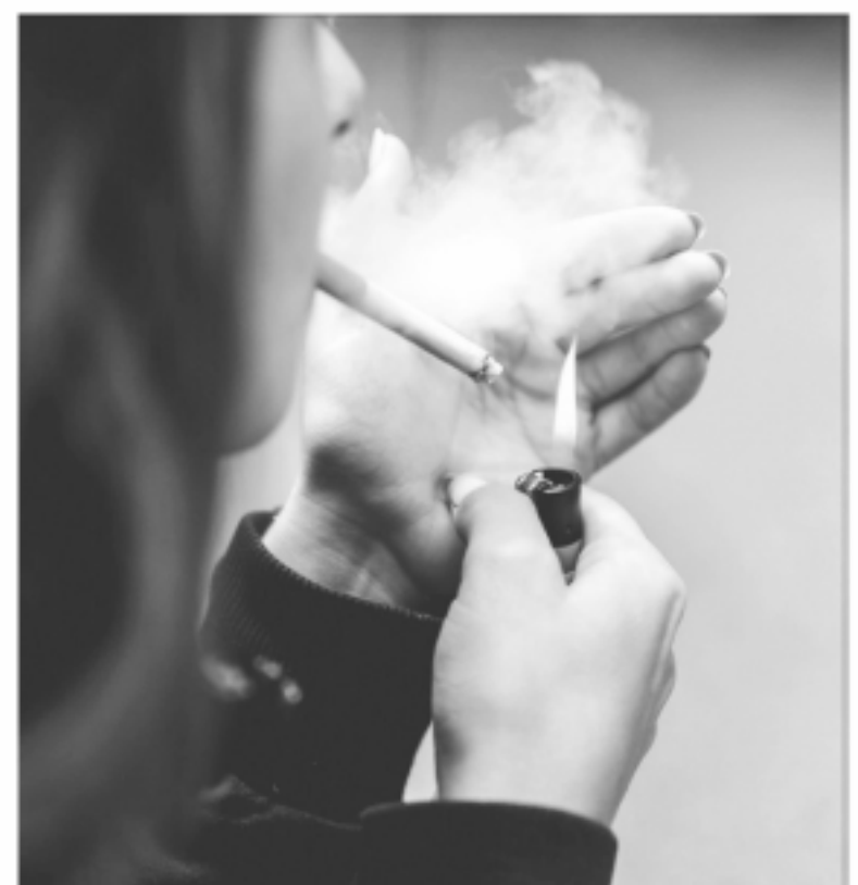
Tabaquismo. Uno de cada cinco adultos es fumador y preocupa el hábito entre los jóvenes.

Otro punto de preocupación que destaca el documento es que en la mayoría de las encuestas