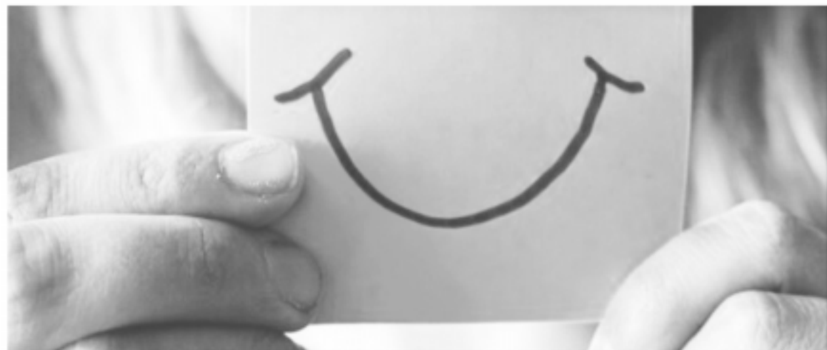
Afecta la comunicación gestual. El síndrome de Moebius es una rara enfermedad neurológica.

Se trata de una patología congénita que afecta la posibilidad de realizar gestos fundamentales para comunicarse.