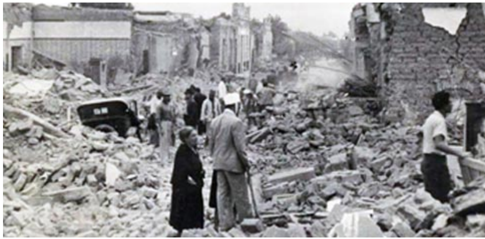
Fotografías que documentan el drama de una ciudad producido en 1.944.

El terremoto destruyó el 80% de la Ciudad de San Juan. Si bien las primeras estimaciones hablaban de 15.000 víctimas, entre muertos y he-