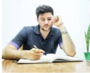
-Por Gonzalo Ciparelli

ban, no necesitaba mirarme al espejo, porque cada vez que tus ojos me miraban me recordabas que linda sonrisa tenía.