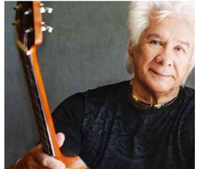
Heredia testigo de una historia dolorosa

El mundo asiste hoy a distintas luchas armadas que dejan huellas de todo tipo a sus participantes. La canción de Heredia se transformó en un alegato contra la guerra.