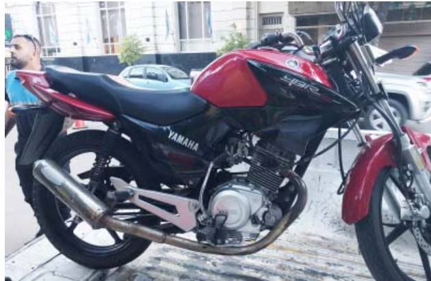
Falta de seguro do. Se dio intervención al Juzgado de Faltas Municipal. Falta de documentación Caño de escape modificado.