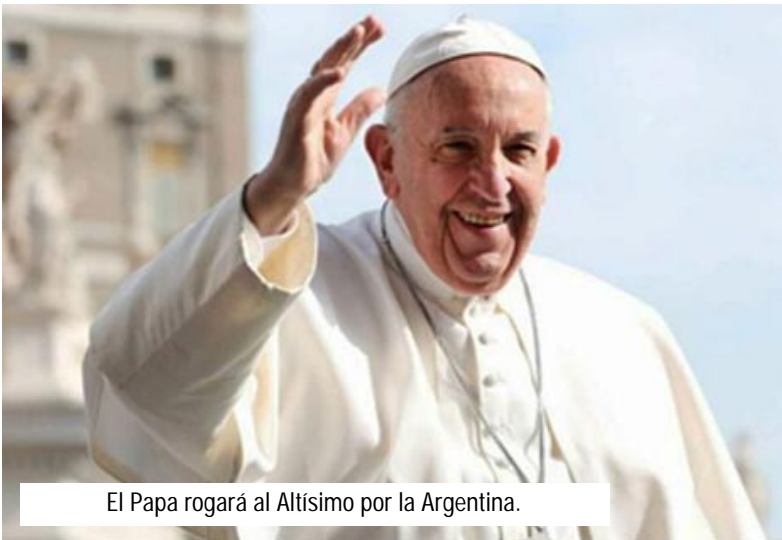
El Papa rogará al Altísimo por la Argentina.