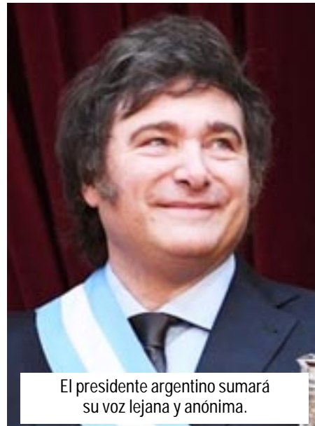
El presidente argentino sumará su voz lejana y anónima.

Fue mucho el cambio que se pretende dar y seguramente la sorpresa ha invadido a más de cuatro. Algunos apoyando y otros suponiendo que es muy grande el cambio que se proyecta. Milei ha dicho que no hay que perder el tiempo dada la situación del país, aunque no parece ser mayoría la cantidad de convencidos respecto a su plan de gobierno.