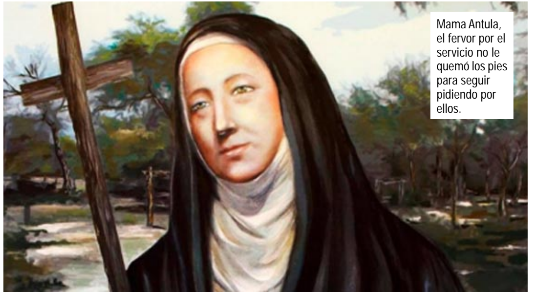
Mama Antula, el fervor por el servicio no le quemó los pies para seguir pidiendo por ellos.

Noticias hay todos los días... deteniéndonos en lo nuestro destaquemos que hubo partidos de fútbol donde los jóvenes de hoy, acunan las virtudes de sus antepasados.