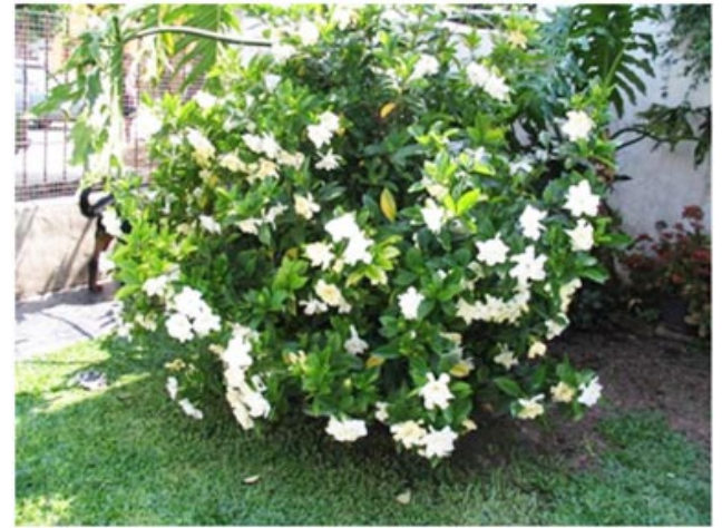
El Jazmín seguirá perfumando el hoy y el futuro, así como lo hizo en el pasado.

El presidente argentino Javier Milei, visitó a personas y edificios con pesadas historias de existencia, mientras que en Buenos Aires dejó señales de poca paciencia, a quienes no lo acompañan, el abrazo con el Papa Francisco fue un aporte a la convivencia que nunca debió ser olvidado.