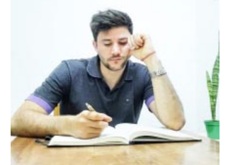
-Por Gonzalo Ciparelli

valor o desea ser como alguien más y aceptado por todos, actúe buscando reconocimiento e interés por medio de la falsedad. Podrá quejarse, podrá hablar, pero no podrá lograr la placentera sensación de ser uno mismo, aunque esto lo pueda conducir a su propio cielo o infierno.