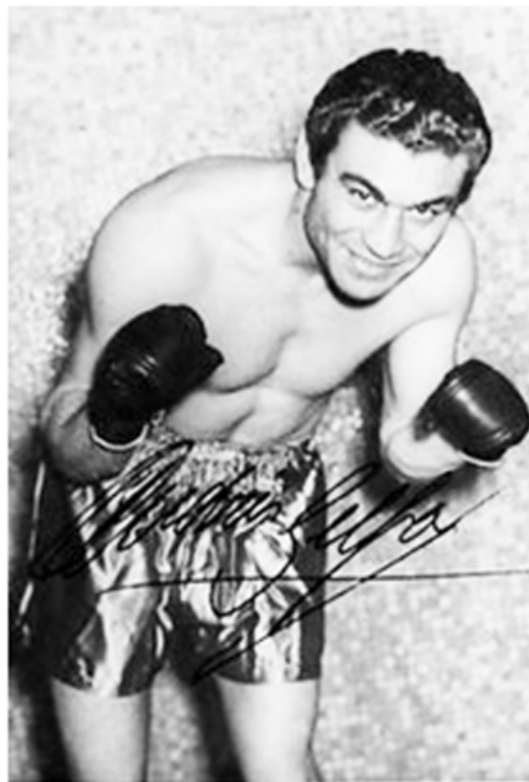
Cacique Selpa, nuestro primer Campeón argentino.

A nivel de cualquier ciudad los productos están sufriendo una suba constante de precios. Hay que reconocer que la repercusión de esas medidas, generó críticas, tal vez no tantas como se esperaba. Será porque estamos acostumbrados a sufrir y aún resta tiempo y medidas para devolver un poco de la esperanza. Esperanza que lo hizo acreedor al 56% de los votos.