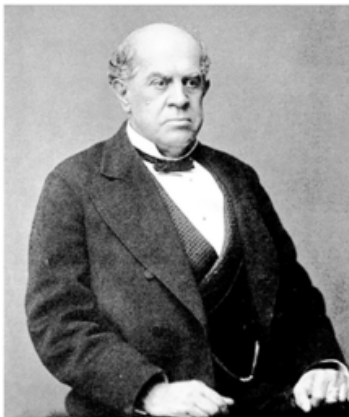
Sarmiento: reconocimiento a su tarea y motivador de nuevos Maestros que seguirán su camino.

Más allá de esa razón, se reconoce una deuda que lleva años insistiendo en el reclamo de salarios justos. El reconocimiento de la sociedad en general mantiene su vigencia. Los gremios docentes en consonancia con ese anhelo tan preciado, deberán agendar esta fecha como una obligación pendiente.