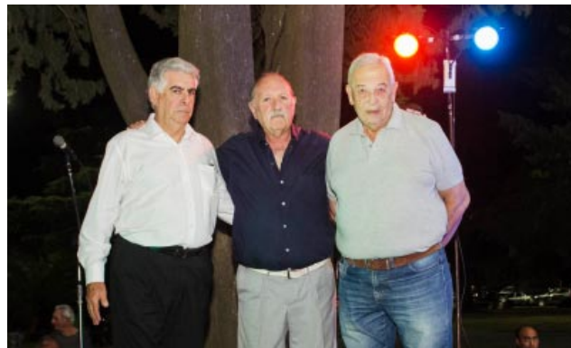
los que se acercaron a compartir una noche a puro tango, marcando así un hito en la propuesta cultural de Bragado.