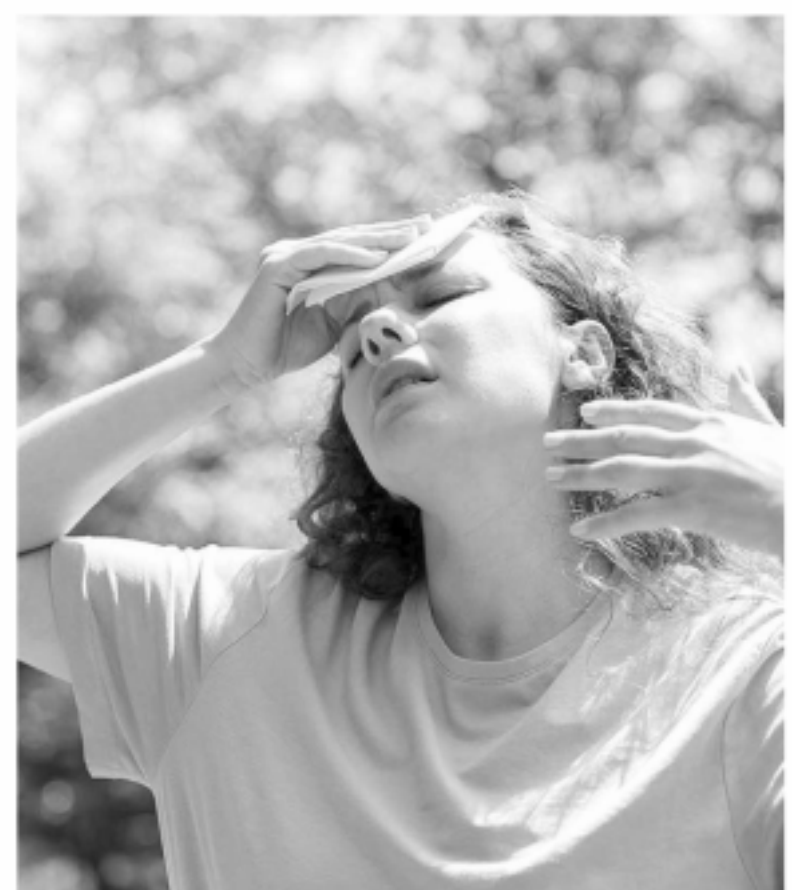
Golpe de calor. Las marcas extremas se mantendrán durante los próximos días en Buenos Aires y más de una decena de provincias.