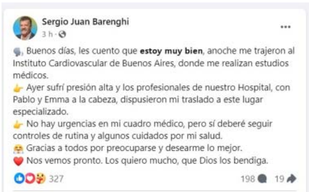
Texto publicado por el Intendente el pasado sábado