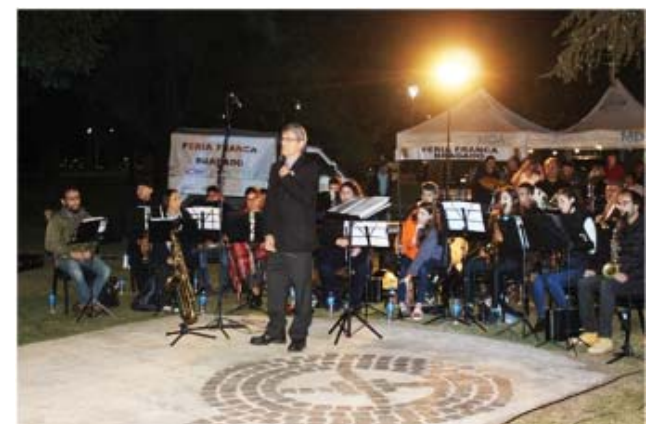
Banda Enrique P. Maroni, adhirió al homenaje ejecutando el Himno Nacional Argentino y Marcha a las Malvinas.

Un remisero en Capital Federal, rechazó trasladar en su auto a una señora que ante la consulta efectuada reconoció que era veterana de la Guerra. El conductor la invitó a dejar el auto en señal de rechazo en una actitud que es para repudiar.