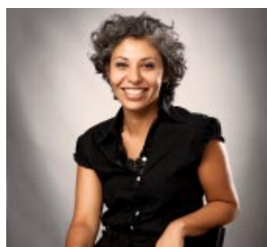
Licenciada en Nutrición (MP 3025), matriculada en el Colegio de Nutricionistas de la Provincia de Buenos Aires.

Para este Día Mundial de la Salud, la Organización Mundial de la Salud (OMS) plan-