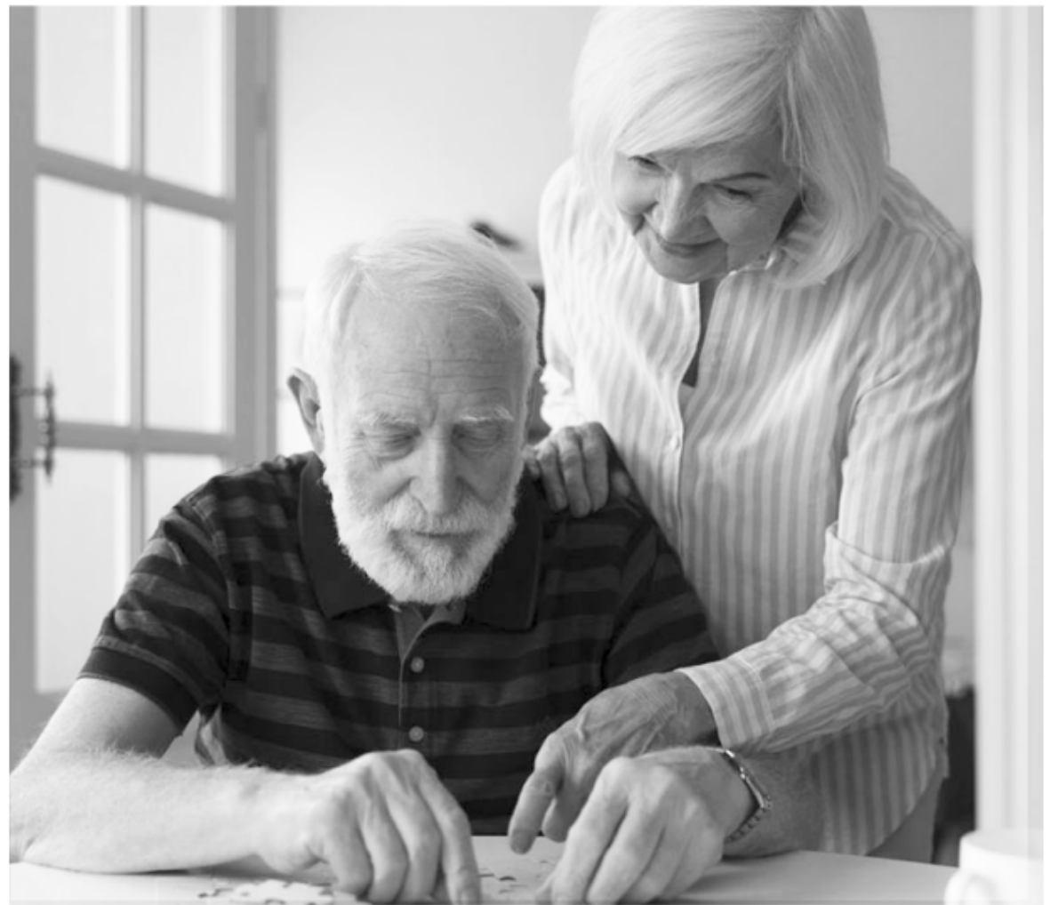
Enfermedades neurodegenerativas. Un fármaco innovador es la promesa para nuevos tratamientos.

→ Las enfermedades neurodegenerativas, como la enfermedad de Alzheimer, la enfermedad de Parkinson o la esclerosis múltiple, son un conjunto patologías caracterizadas por el progresivo deterioro de la función motora y/o cognitiva, a partir de la pérdida selectiva de neuronas del sistema nervioso central.