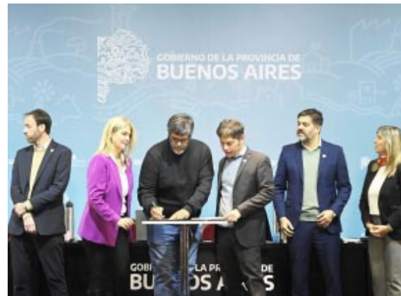
Gobernador Axel Kicillof la Vicegobernadora Verónica Magario y el Ministro de Gobierno Carlos Bianco. Firma del Fondo de Fortalecimiento Fiscal Municipal y convenio de cooperación con CFI en el Teatro Argentino de La Plata. Por Bragado, el Intendente Interino Elvio Duretti

El instrumento fue creado en diciembre de 2023, a través de la Ley N°15.480, que regula la transferencia de fondos no reintegrables y de libre disponibilidad en base al Coeficiente Único de Distribución (CUD).