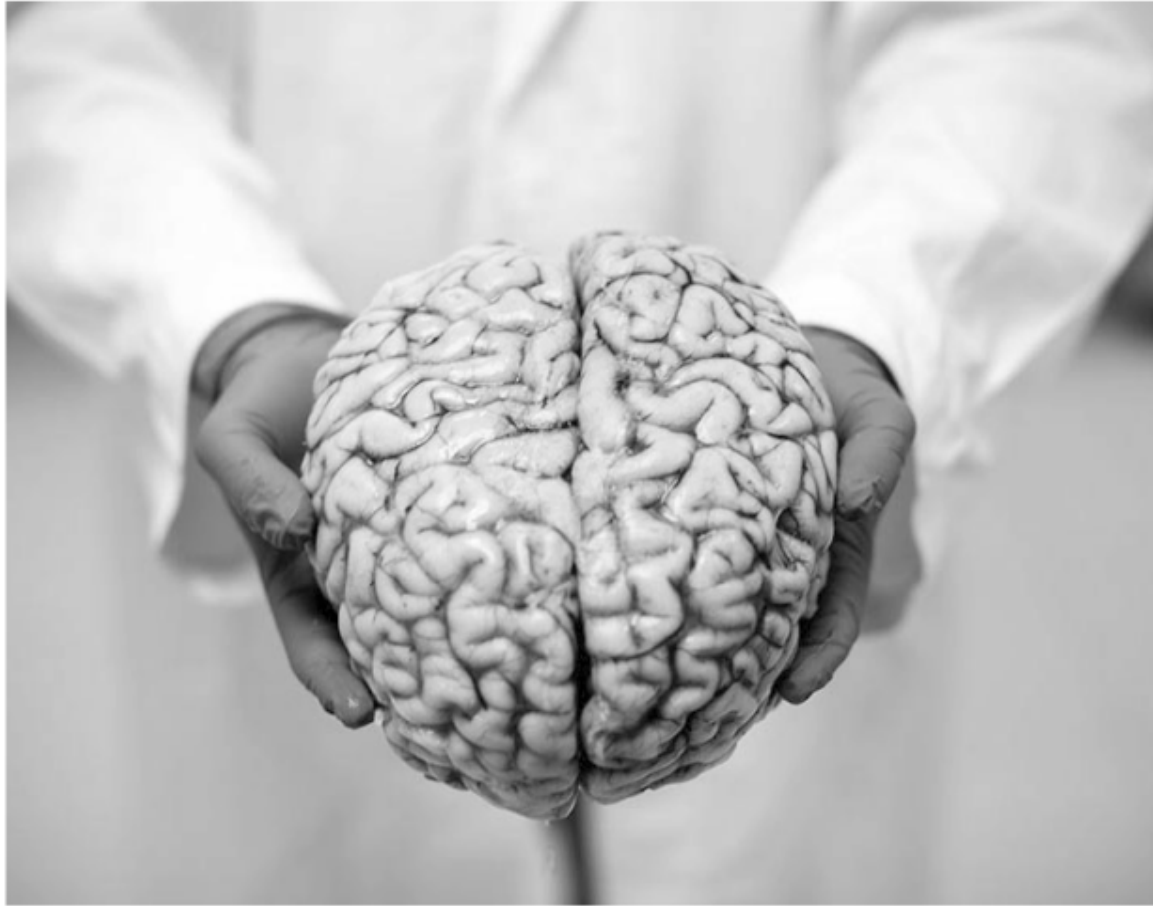
Alzheimer. Una investigación planteó que algunas personas pueden sufrir cambios cerebrales relacionados con el trastorno degenerativo.

Una investigación planteó que algunas personas pueden sufrir cambios cerebrales relacionados con el trastorno degenerativo.