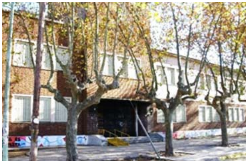
La Escuela Normal registra una brillante labor en beneficio de la enseñanza en general.