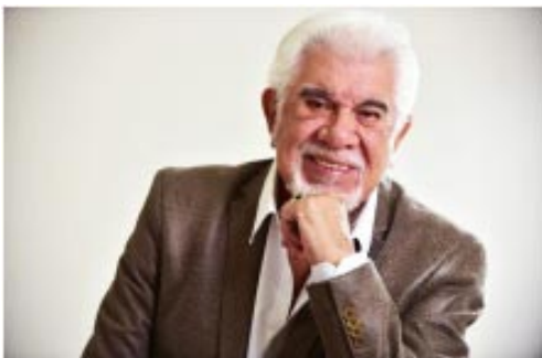
Raúl Lavié, cantor que canta temas varios con predominio de tango.

El próximo domingo en el Teatro Constantino de nuestra ciudad se presentará el cantor Raúl Lavié. Su espectáculo encierra un relato donde se unen Carlos Gardel y Astor Piazzolla. Lavié que se califica como cantor popular, anunció que la función del domingo estará dirigida al cuartel de Bomberos de Bragado, descontando que asistirá mucho público para presenciar el espectáculo.