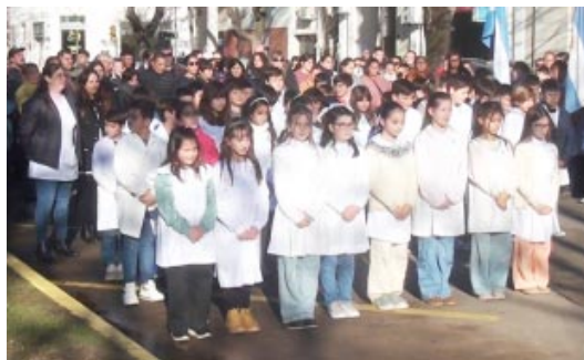
Sí Prometo!!!! Que la calidad de ese grito se mantenga en el corazón de los niños que nunca mienten.

Rogamos elevando los ojos, al cielo, seamos capaces de recuperar al niño que alguna vez fuimos.