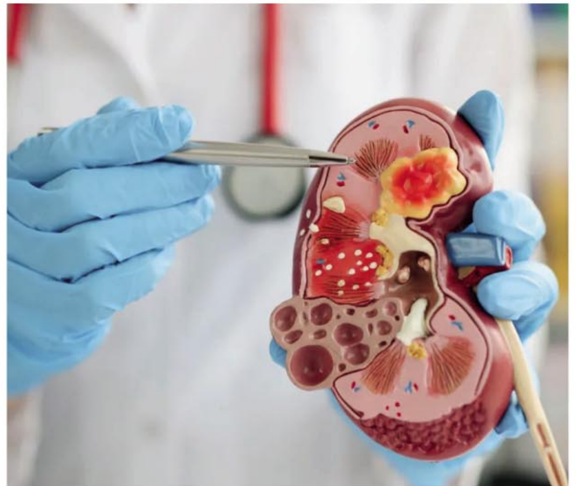
Cáncer de riñón. En la Argentina el cáncer de riñón es el quinto tumor en incidencia.

El tratamiento del cáncer renal tiene a la cirugía como primera y principal opción, ofreciendo elevados niveles de curación, sobre todo en los casos no metastásicos detectados tempranamente. Luego existen tratamientos novedosos complementarios a la cirugía para aquellos casos localizados de mayor riesgo y, para los estadios