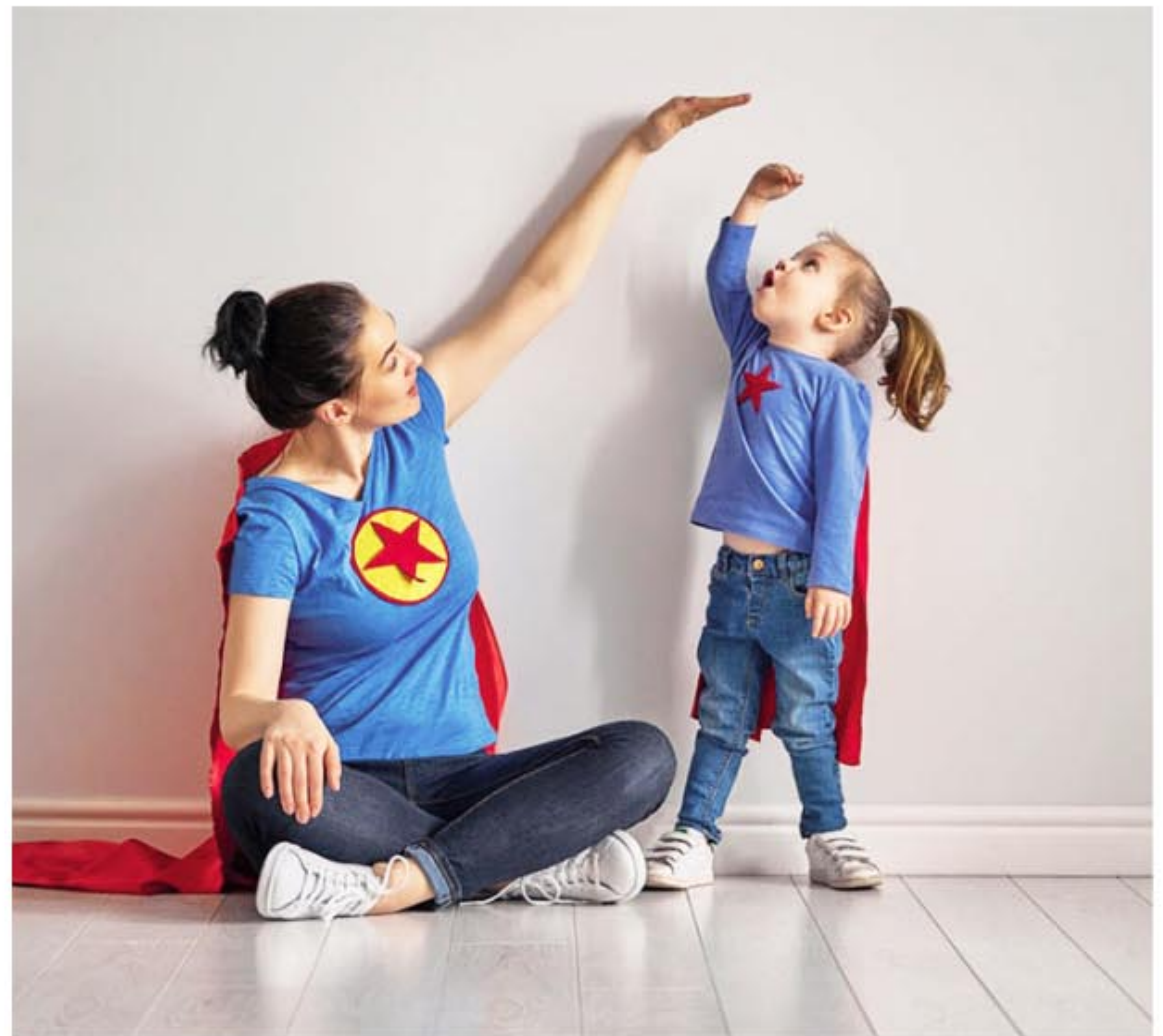
Talla baja. Dispositivos digitales facilitan la adherencia al tratamiento.

"Cuando vemos mala respuesta en el tratamiento, comenzamos a indagar sobre las posibles causas, modificamos dosificación y demás, pero muchas veces lo que está sucediendo es que el paciente no está teniendo una buena adherencia; saltea dosis por olvido, distracción o cansancio. Hay que entender que los tratamientos son muy largos y que los chicos se cansan. Sobre todo, cuando son adolescentes, que siempre encuentran excusas para postergar o diferir las aplicaciones. Pero esta falta de respuesta generaba cierto desconcierto en cuanto a las estrategias de tratamiento. Desde la llegada de los nuevos dispositivos aplicadores, podemos saber con precisión si la adherencia es subóptima y trabajar para mejorar esa falta de cumpli-