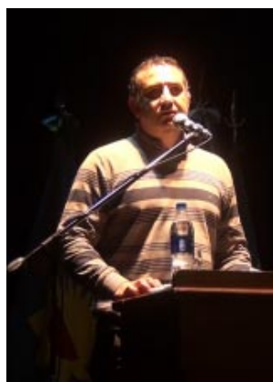
...ticas y actividades infantiles. Hoy jueves, se realizará la segunda y última jornada.

El inicio de la Expo coincidió con el Día Mundial del Medio Ambiente y hubo espacio para charlas informativas, exposición de trabajos de las escuelas, intervenciones artísticas y actividades infantiles. Hoy jueves, se realizará la segunda y última jornada.