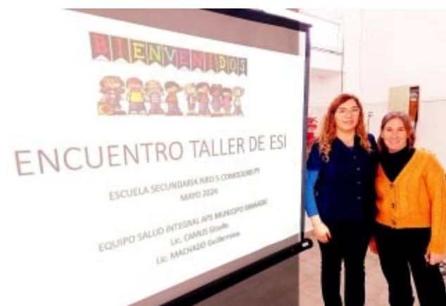
un taller de ESI (Educación Sexual Integral) a los alumnos de 1º, 2º, 3º y 4º año.