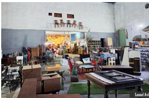
Vista actual del salón. En lo alto se observan las ventanas desde donde se proyectaba el cine.