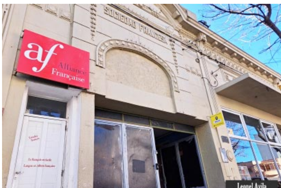
Frente del edificio de la Sociedad Francesa de Socorros Mutuos.