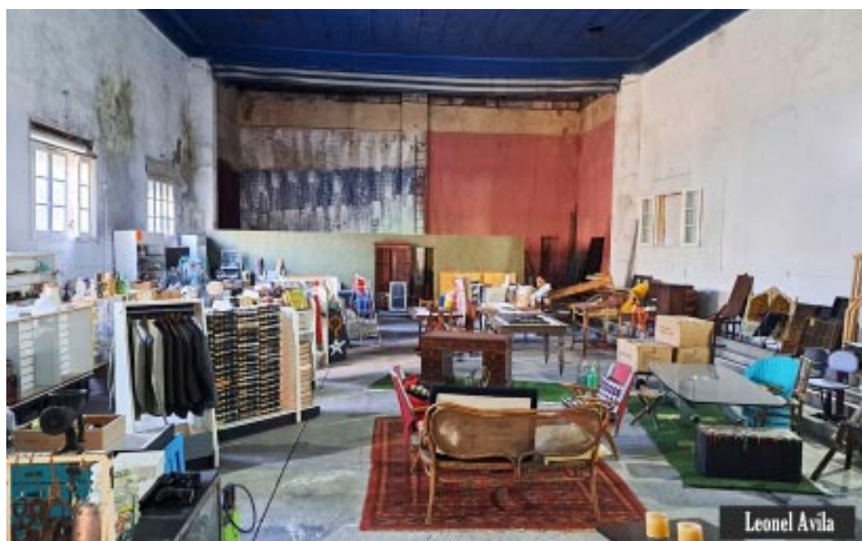
Lo que queda del viejo Teatro Francés / Club Americano.