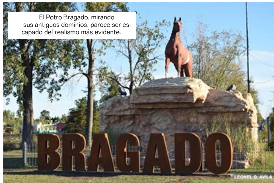
El Potro Bragado, mirando sus antiguos dominios, parece ser escapado del realismo más evidente.