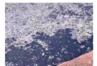
Miles de peces muertos en el río Arrecifes.

tuación es más grave en Carmen de Areco, a 40 kilómetros, donde el balneario municipal, declarado Parque Ambiental, presenta un lecho que huele a pescado podrido. (InfoGEI)Ac