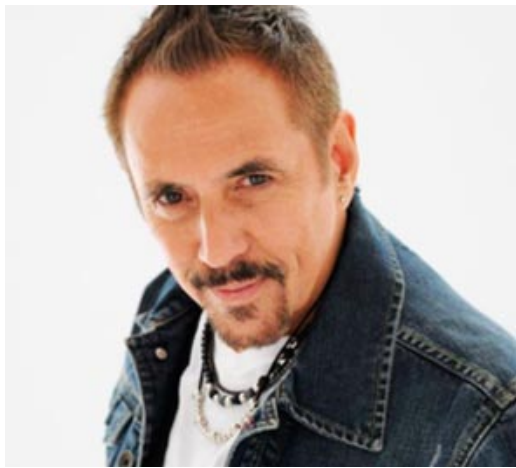
Alejandro Lerner, músico respetado en el país y el mundo.