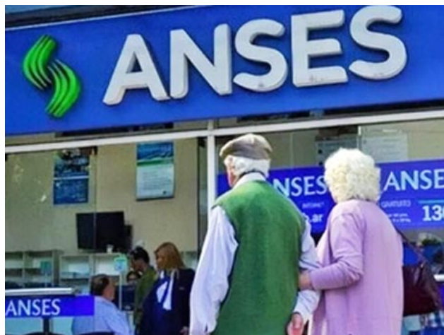
La clase pasiva en nuestro país sueña con montos jubilatorios dignos.

La forma en que votaron los legisladores hace pensar que estamos en inicio de un largo proceso. Ojalá que el resultado