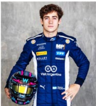
Franco Colapinto, joven piloto que debutará en Fórmula 1.

Fue campeón del Campeonato de España de F4 en 2019, tercero en los campeonatos de Toyota Racing Series y Eurocopa de Fórmula Renault (ambos en 2020), Asian Le Mans Series (2021), cuarto en el Campeonato de Fórmula 3 de la FIA (2023), y compitió en el Campeonato de Fórmula 2 de la FIA con el equipo MP Motorsport durante diez rondas en 2024. Es miembro de la Academia de pilotos de Williams desde 2023.