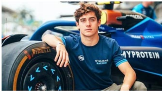
Colapinto: tiene condiciones y futuro.

Max Verstappen, pasará al equipo Red Bull, junto a Sergio Pérez.